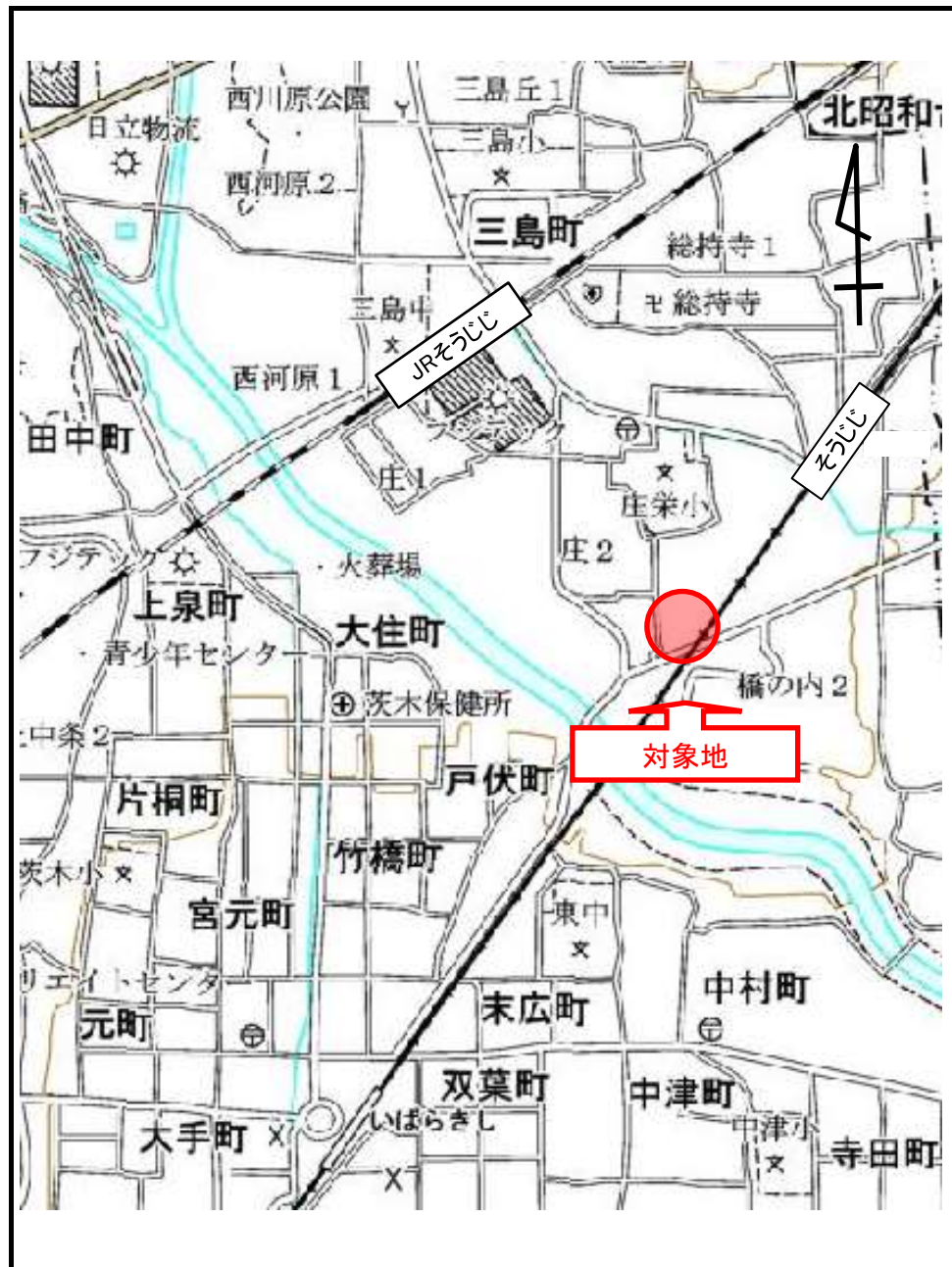
(1)位置図(物件番号:第1号)