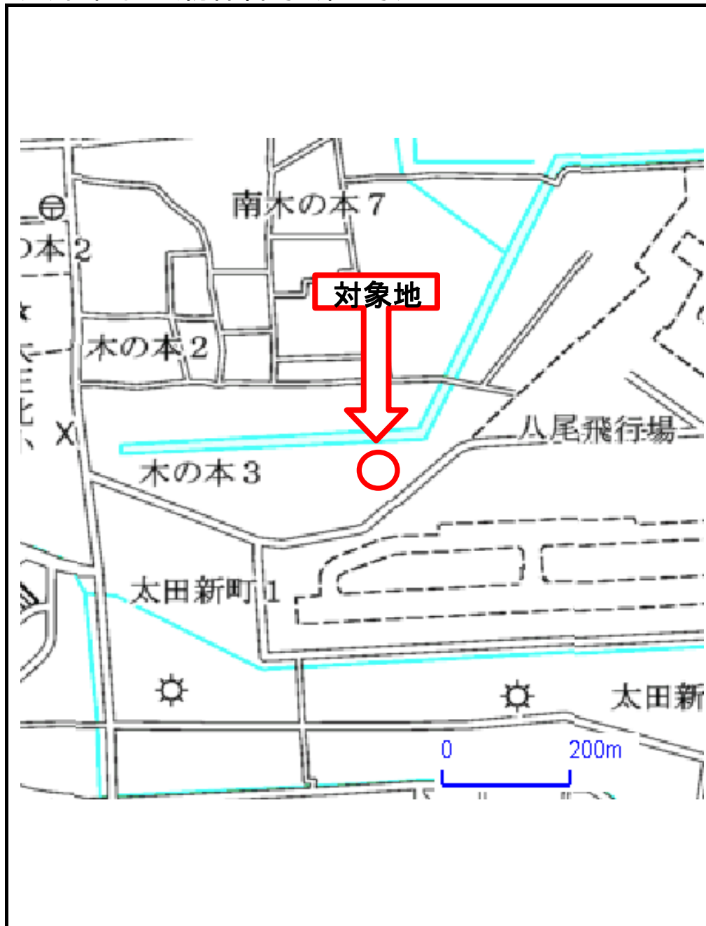
(1)位置図 (物件番号:第3号)