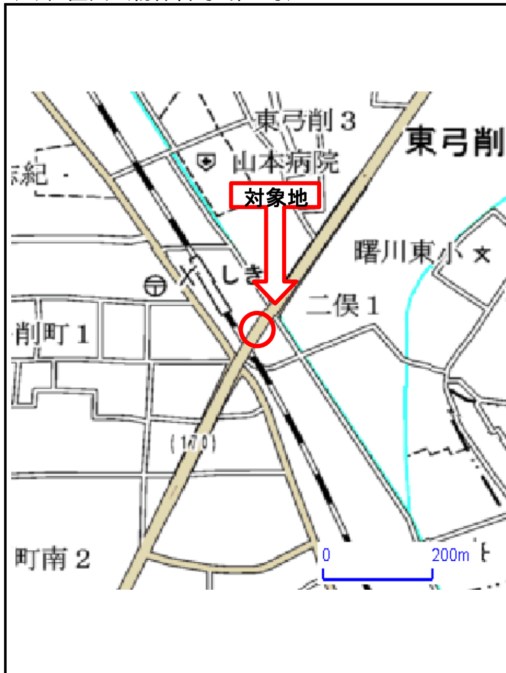
(1)位置図 (物件番号:第3号)