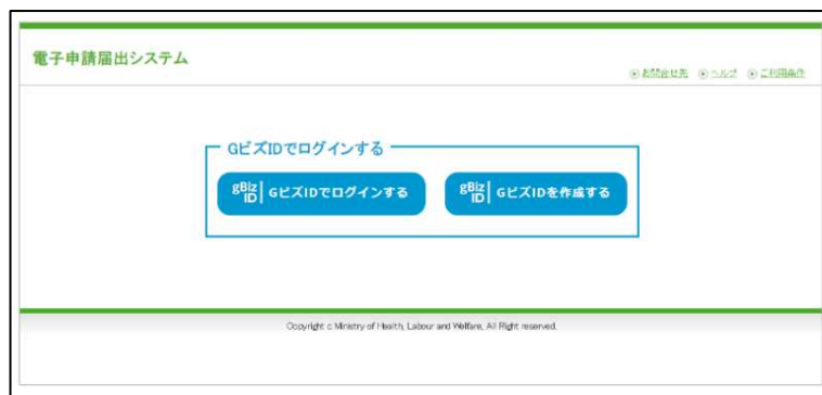
【本システムのログイン画面イメージ】

本システムでご利用できるGビズIDのアカウント種類は、「gBiz IDプライム」と「gBiz IDメンバー」のみになります。