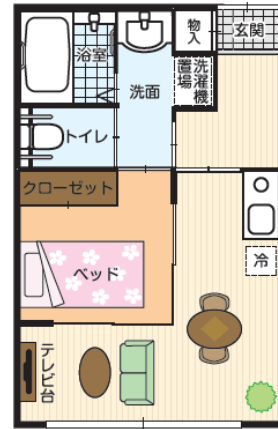
図1 元気な方向けの居室のイメージ