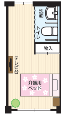
図2 介護の方向けの居室のイメージ