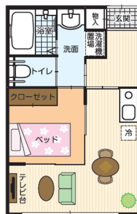
図1 元気な方向けの居室のイメージ