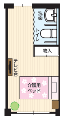
図2 介護の方向けの居室のイメージ