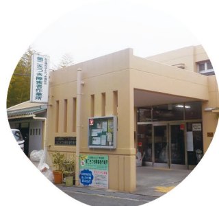
第二さつき障害者作業所