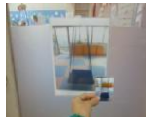
事業所内の環境設定や、活動の見通し表の作成