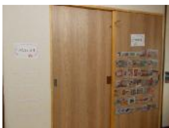
余暇時間の中で使える課題の作成や、遊べるおもちゃのリスト作り