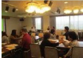
事業所の職員の方向けの研修