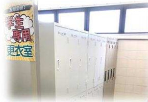
学生専用ロッカー