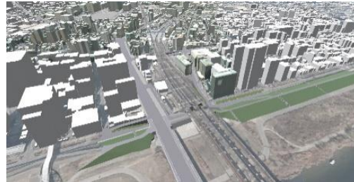
十三駅と淀川河川敷付近の鳥瞰