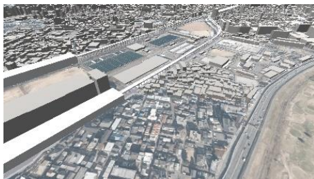
淡路駅から柴島浄水場付近の鳥瞰 (高架化後の空間)