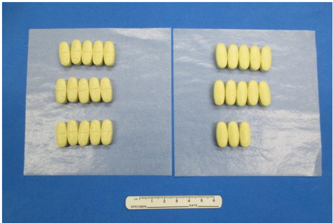
中に入っていた錠剤を薬包紙に並べた様子 (28錠入り)