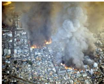
阪神・淡路大震災時の被災状況(1995年1月17日)