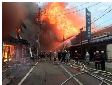
糸魚川市大規模火災時の被災状況(2016年12月22日)