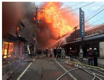
糸魚川市大規模火災時の被災状況(2016年12月22日)