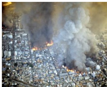
阪神・淡路大震災時の被災状況(1995年1月17日)