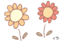
イラスト: 緒川 翠々