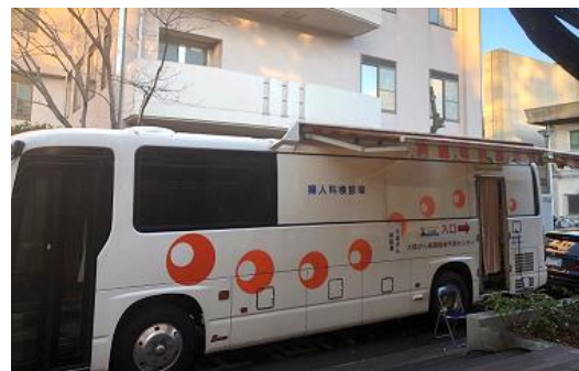
■ 子宮頸がん検診車