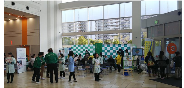
■ 商業施設での アスマイル普及イベント