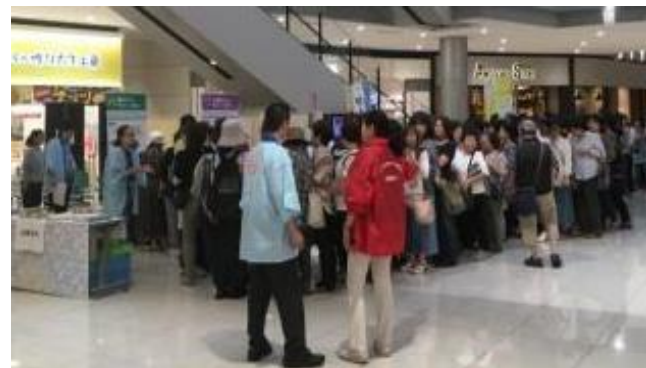
■ 乳がん検診受診の受付