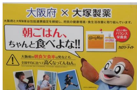
■ 連携ポスターの 作成と掲示