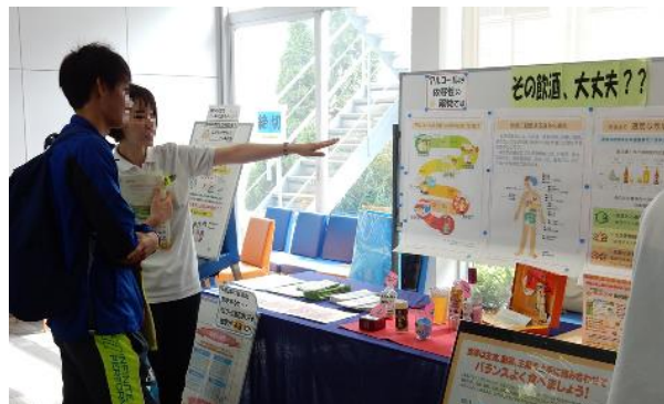
■大学での適量飲酒チェック