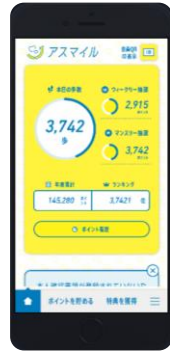
■ アスマイルアプリ