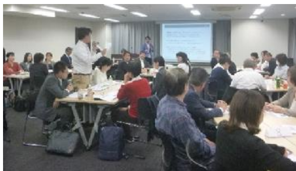
■ワークショップ方式（実践型）セミナー