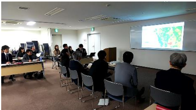
■ヘルスアップ会議