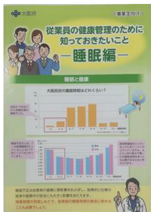
■リーフレットの作成