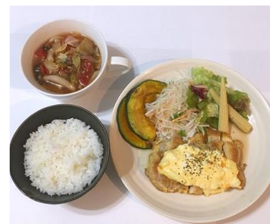
■ 近畿大学オリジナル V.O.S.メニュー