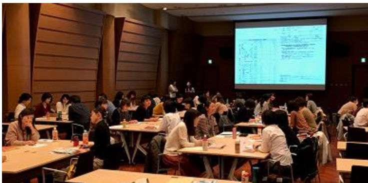
■特定保健指導 ワーキング