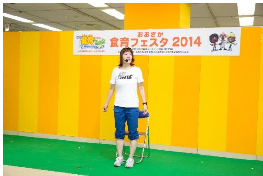
◇フィットネス21事業団「健康づくり講習会」