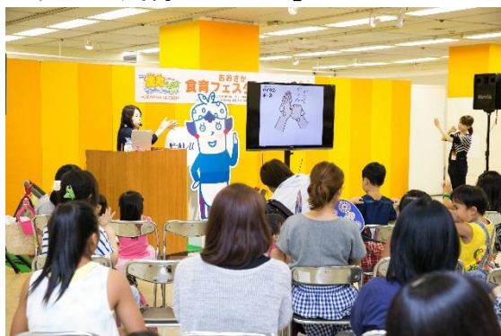
◇食育推進企業団参画企業 花王「食育ステージ」