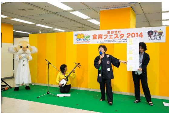
◇大阪府栄養士会「食育ステージ」