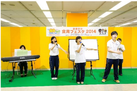
◇食育ヤングリーダーアトラクション 箕面学園福祉保育専門学校