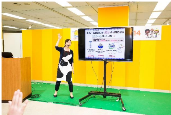
◇食育推進企業団参画企業 明治「食育ステージ」