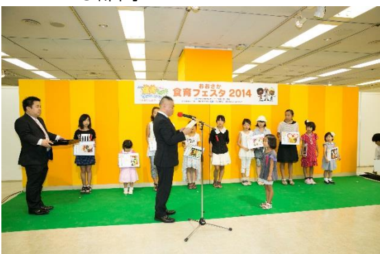
◇第13回愛情お弁当コンテスト表彰式 こども部門