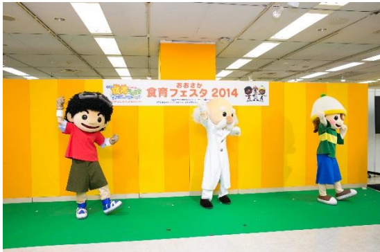
◇食育推進キャラクターによるオープニングダンス