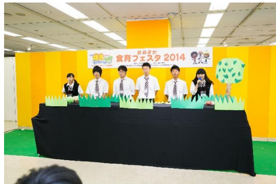
◇食育ヤングリーダーアトラクション 大阪府立りんくう翔南高等学校