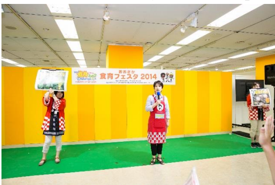
◇JA大阪中央会「食農クイズ大会」