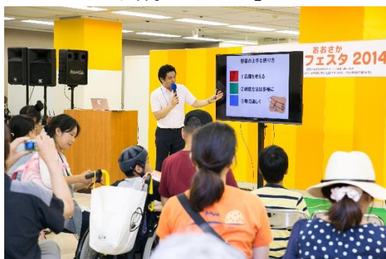
◇食育推進企業団参画企業 カゴメ「食育ステージ」