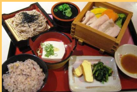
特別賞 (公財)関西・大阪21世紀協会理事長賞 「豚肉と野菜の蒸籠蒸し御膳」 ポプリンキッチン住道店(大東市)