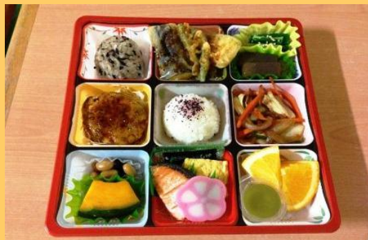
高齢者向けヘルシーメニュー部門 最優秀賞