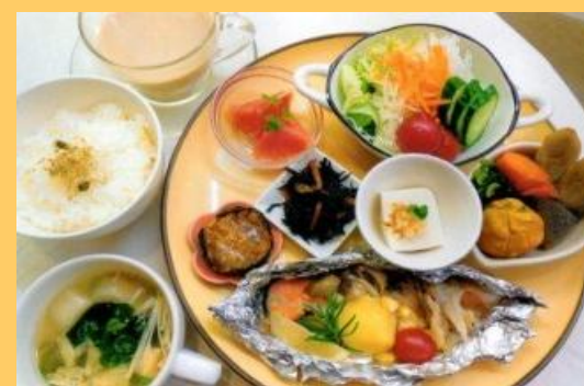
ヘルシーメニュー部門 優秀賞