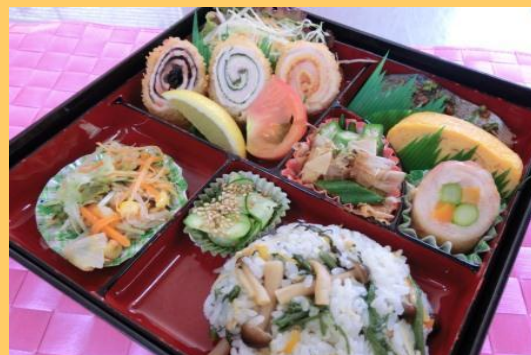
ワンコインヘルシー弁当部門 最優秀賞