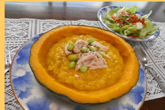
奨励賞 「かぼちゃと彩り食材のアンサンブル」 ノワ・ド・ココ(豊中市)