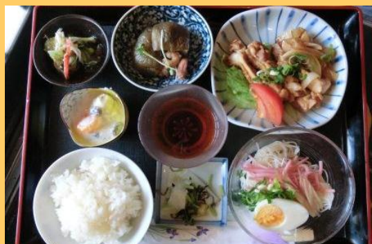
ヘルシーメニュー部門 優秀賞