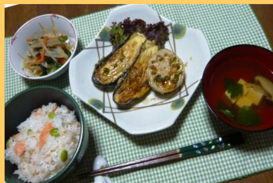
奨励賞 「茄子と蓮根のはさみ焼き～甘酢だれかけ～」 ふたは(高槻市)