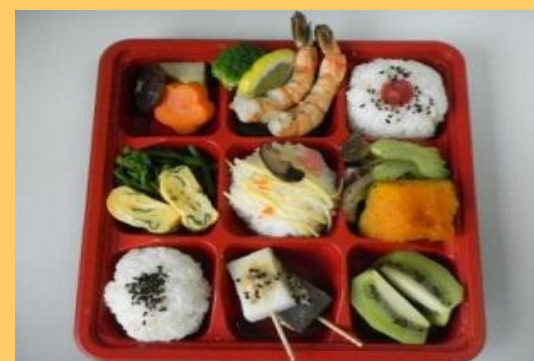
特別賞 (公社)大阪食品衛生協会会長賞 「おいしい塩分ひかえめ弁当」 惣菜・弁当・お食事処 旬菜(羽曳野市)