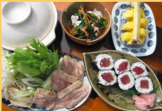
奨励賞 「鴨洛部煮風一人鍋と鉄火巻きの定食」 志乃家(堺市)