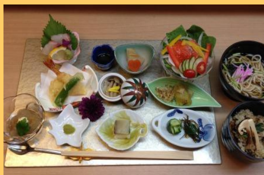
ヘルシーメニュー部門 優秀賞