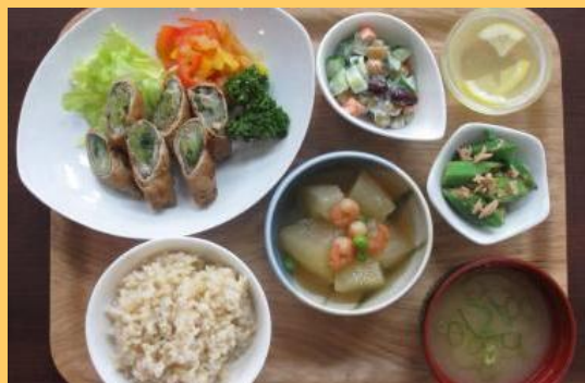
ヘルシーメニュー部門 最優秀賞