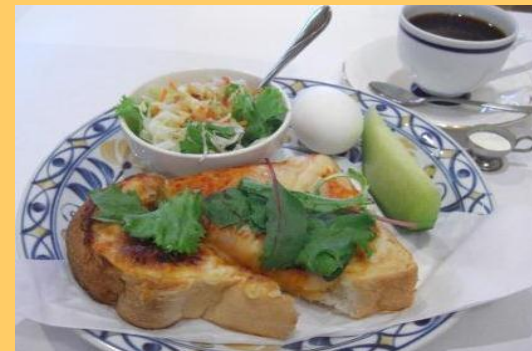
ヘルシー朝食メニュー部門 最優秀賞