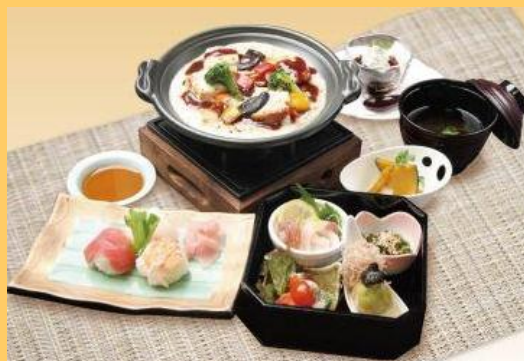
特別賞 大阪府調理師団体連合会会長賞 「豆腐とろろグラタン御膳」 株式会社 本家さぬきや(泉大津市)