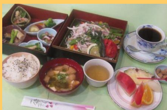
ヘルシーメニュー部門 優秀賞