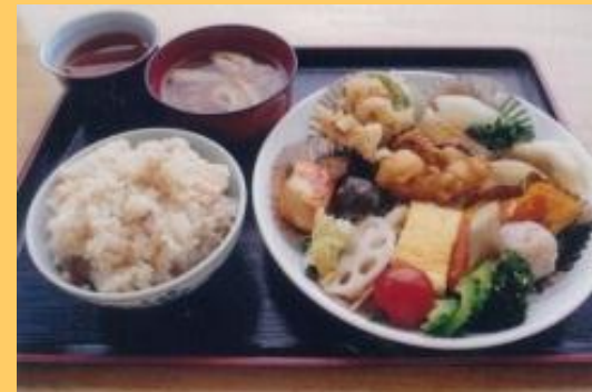
ヘルシーメニュー部門 優秀賞