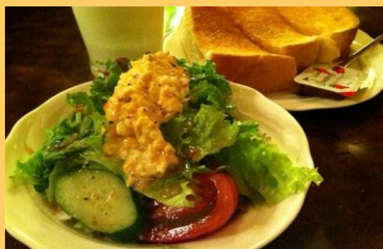
ヘルシー朝食メニュー部門 優秀賞