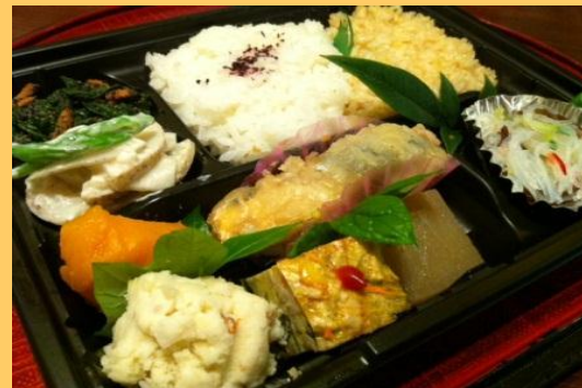
ワンコインヘルシー弁当部門 優秀賞