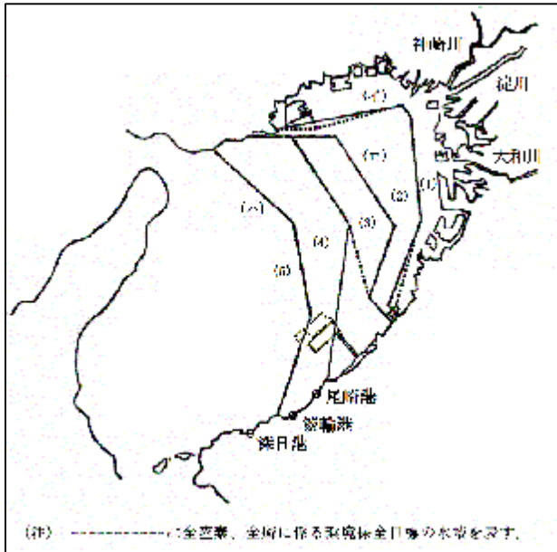
図1-1 大阪湾における水域類型