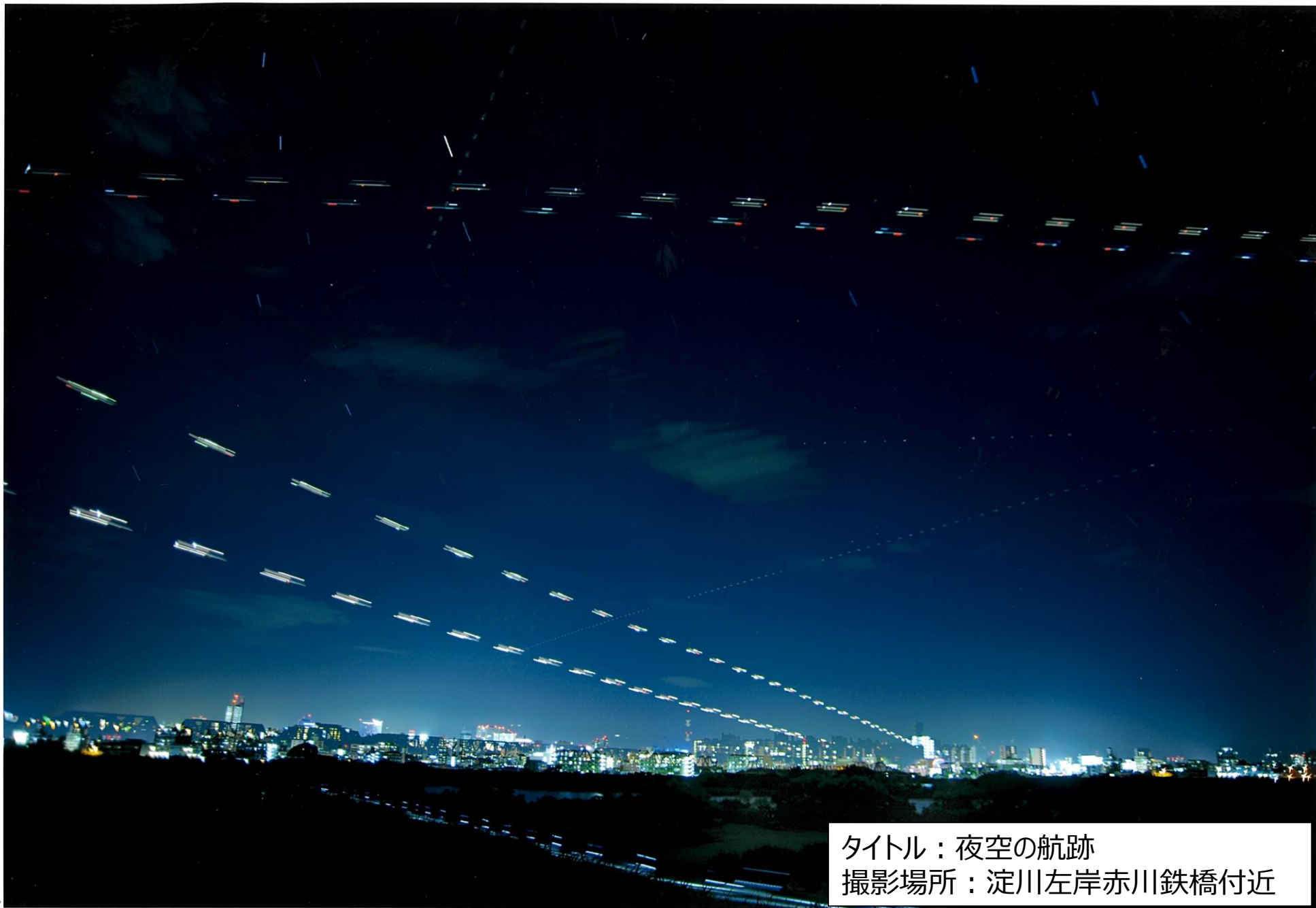
タイトル：夜空の航跡 撮影場所：淀川左岸赤川鉄橋付近