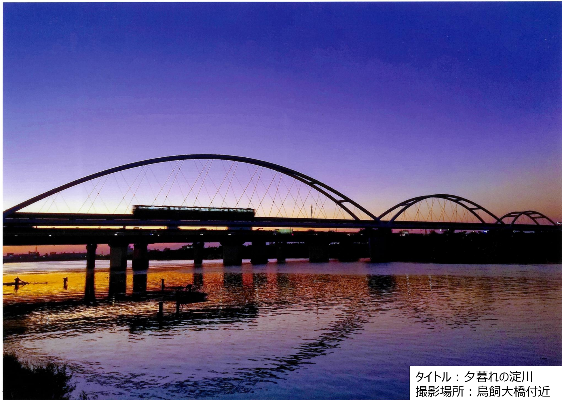
タイトル：夕暮れの淀川 撮影場所：鳥飼大橋付近