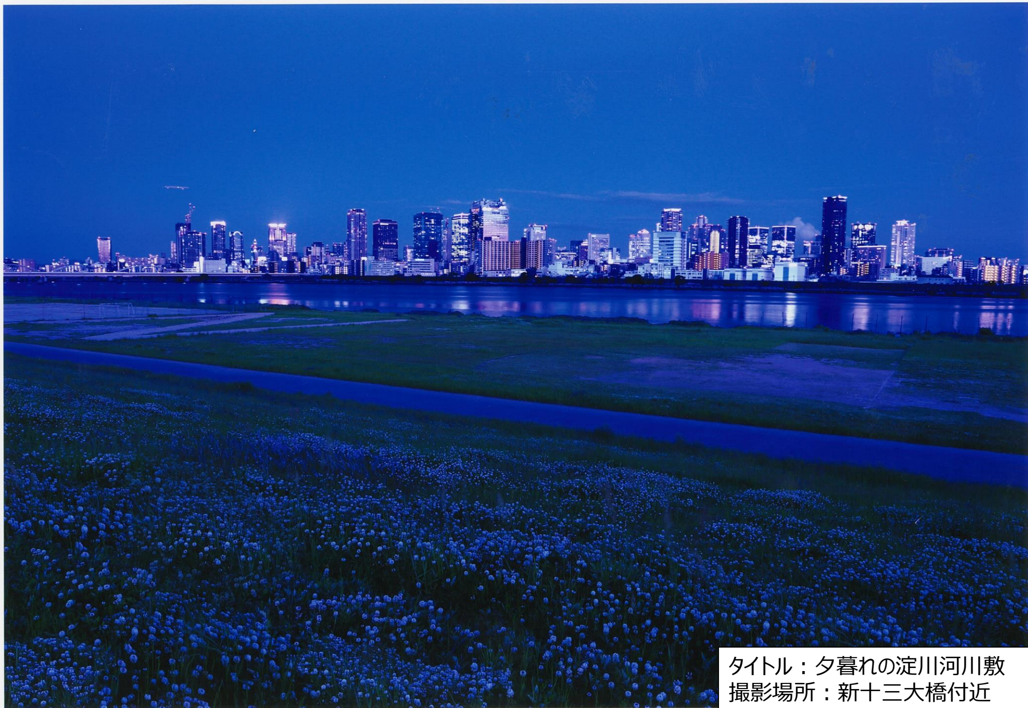
タイトル：夕暮れの淀川河川敷 撮影場所：新十三大橋付近