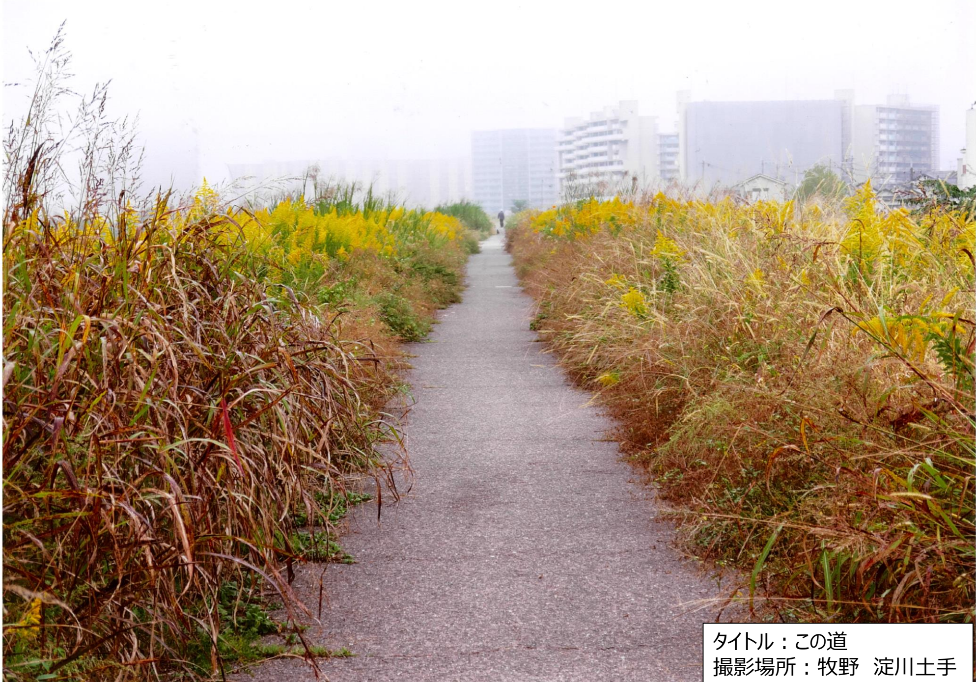
タイトル：この道 撮影場所：牧野 淀川土手