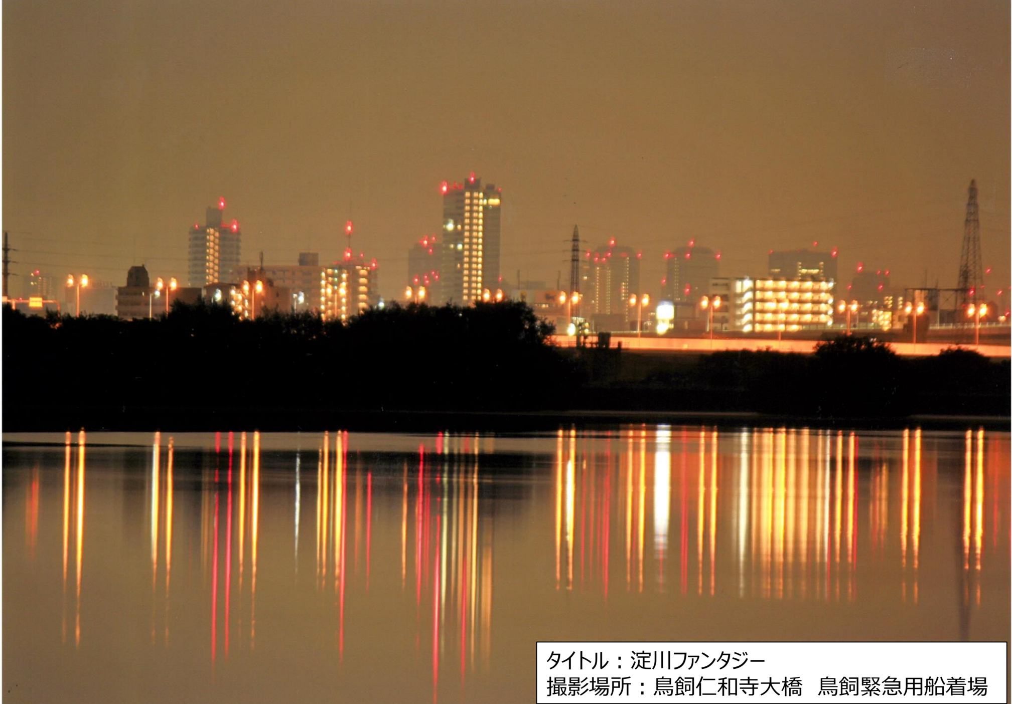
タイトル：淀川ファンタジー 撮影場所：鳥飼仁和寺大橋 鳥飼緊急用船着場