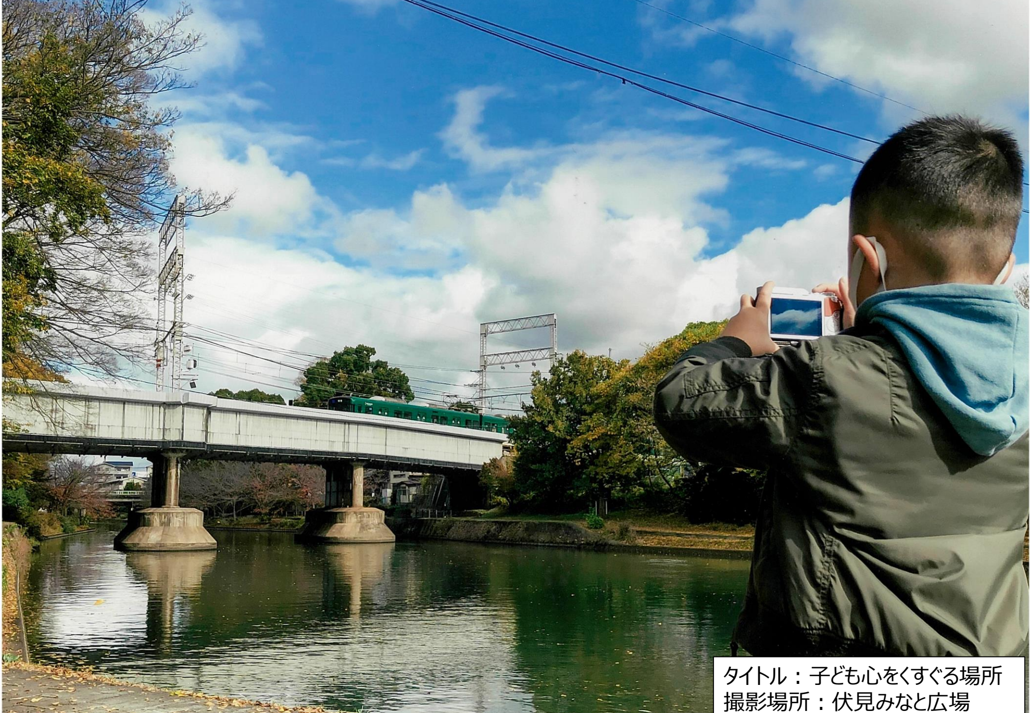
タイトル：子ども心をくすぐる場所 撮影場所：伏見みなと広場