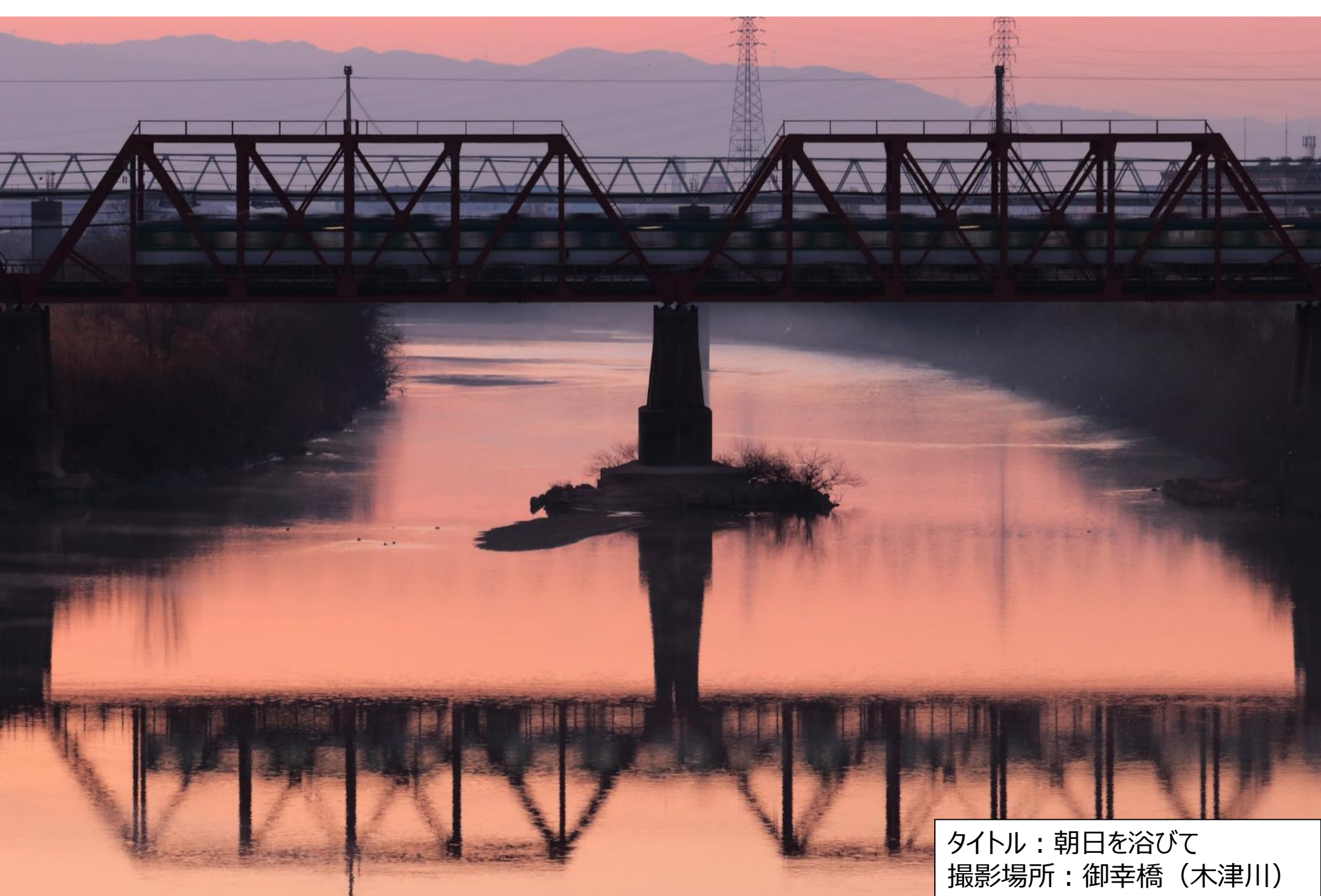
タイトル：朝日を浴びて 撮影場所：御幸橋（木津川）