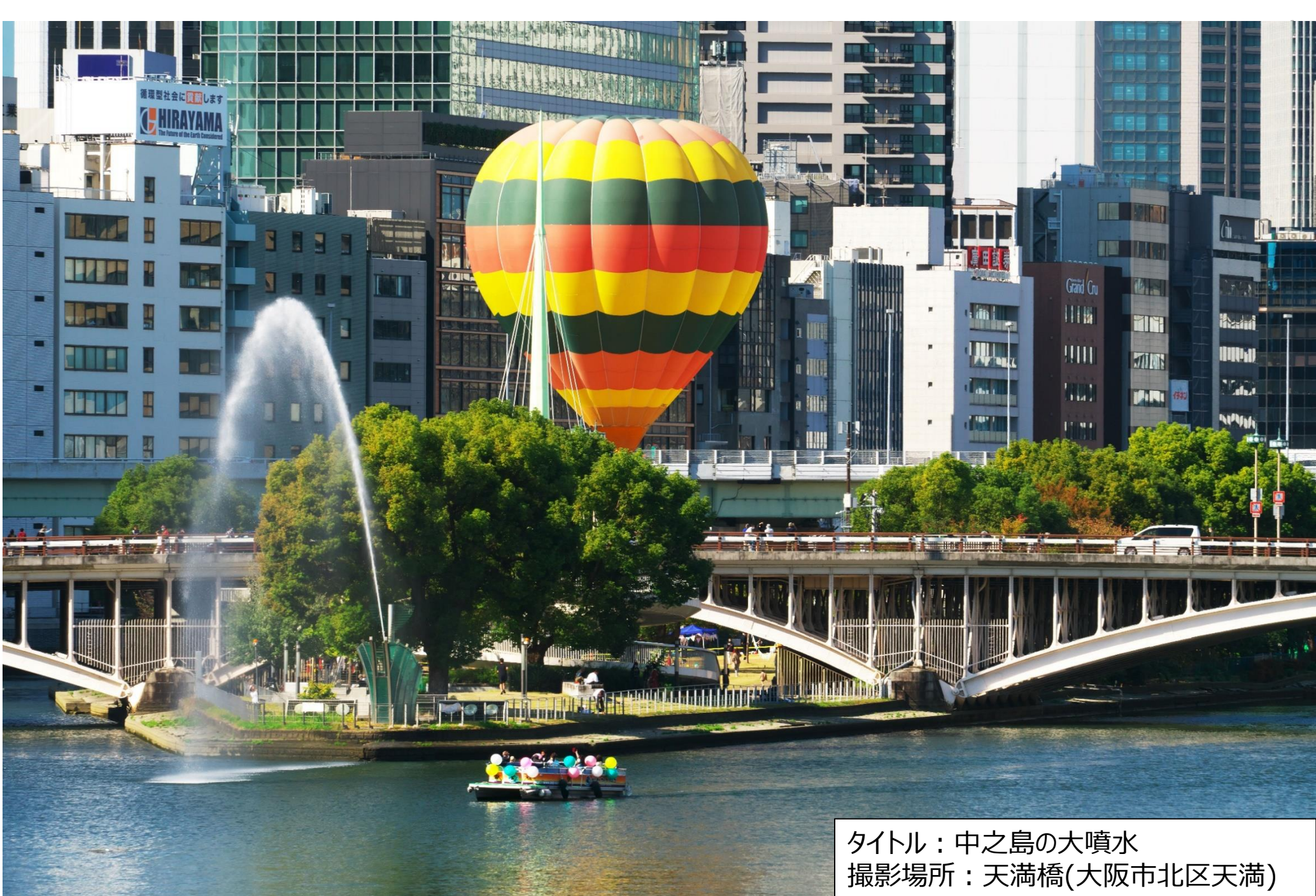
タイトル：中之島の大噴水 撮影場所：天満橋(大阪市北区天満)