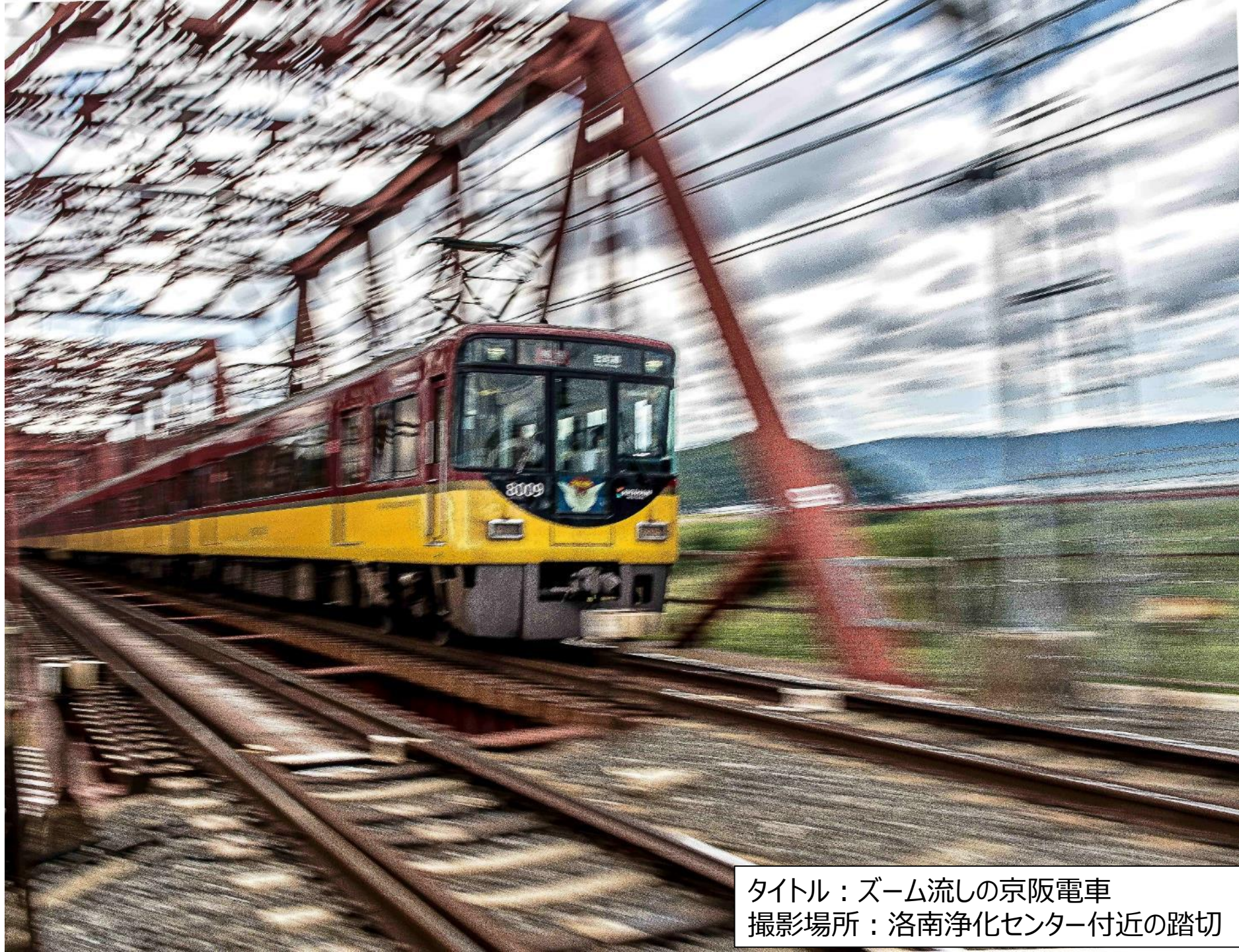
タイトル：ズーム流しの京阪電車 撮影場所：洛南浄化センター付近の踏切