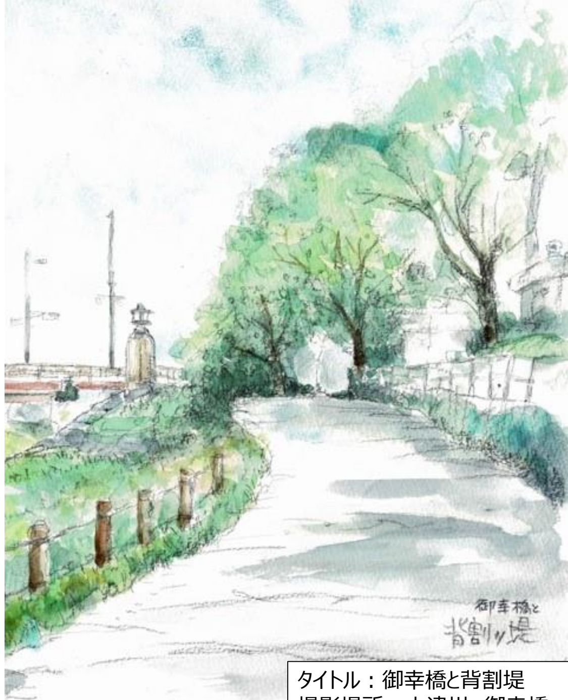
タイトル：御幸橋と背割堤 撮影場所：木津川 御幸橋