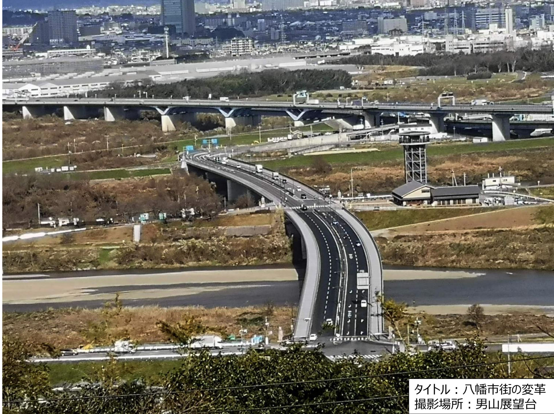
タイトル：八幡市街の変革 撮影場所：男山展望台