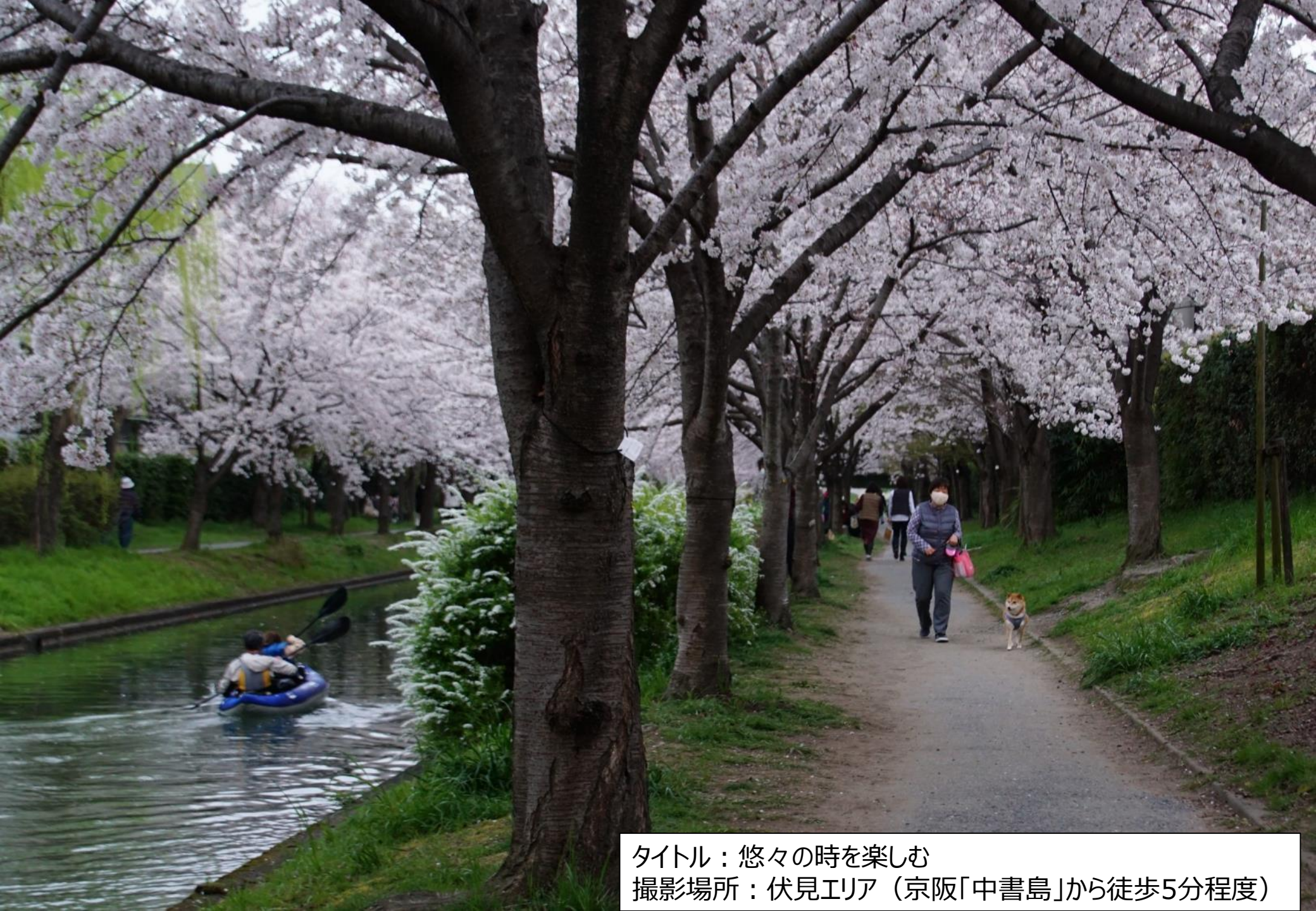
タイトル：悠々の時を楽しむ 撮影場所：伏見エリア（京阪「中書島」から徒歩5分程度）