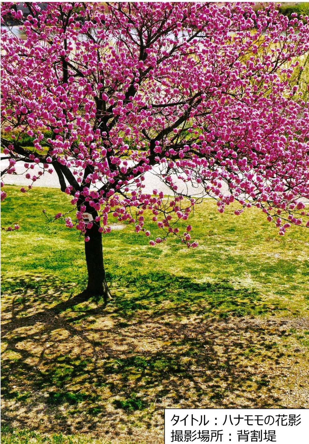
タイトル：ハナモモの花影 撮影場所：背割堤