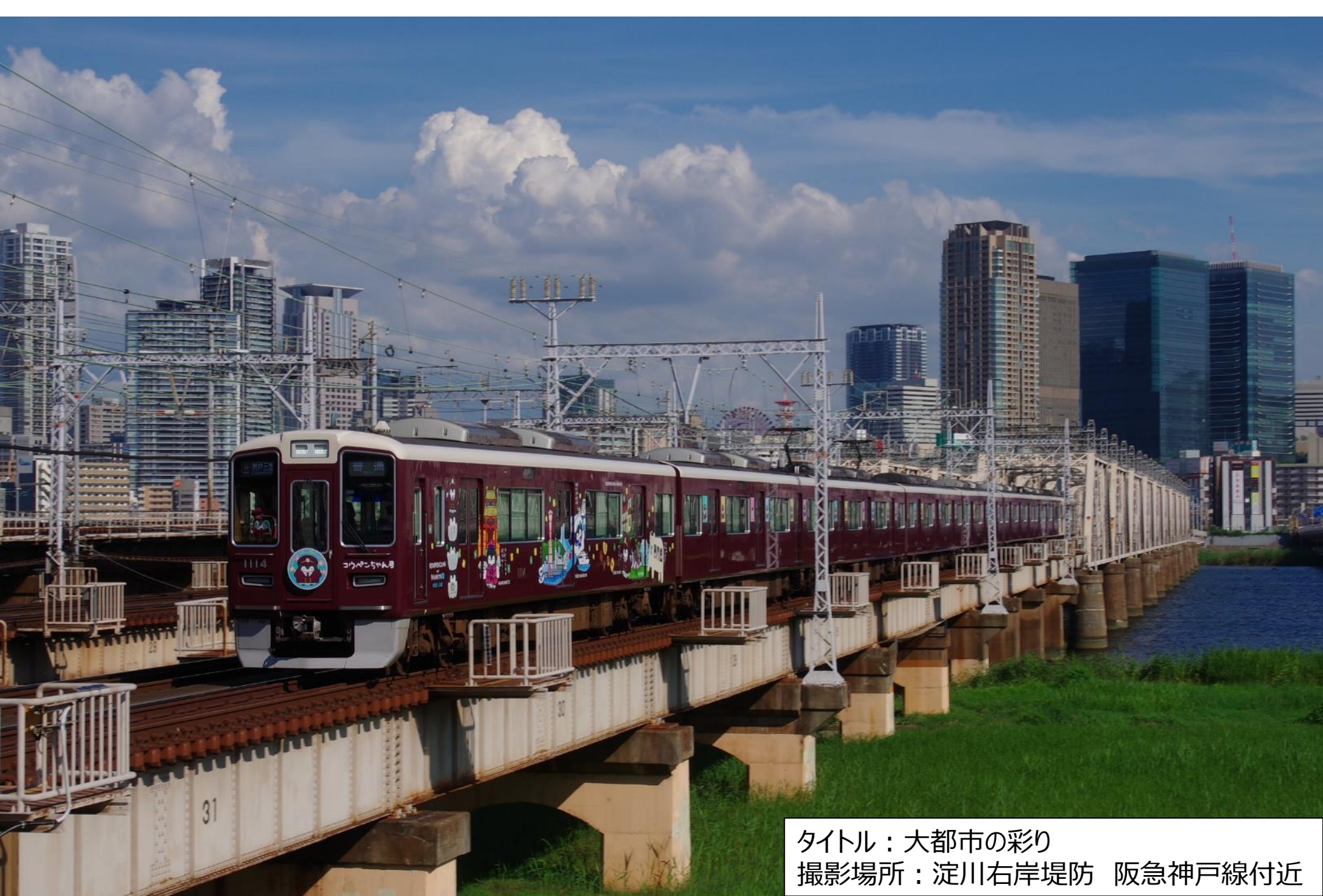
タイトル：大都市の彩り 撮影場所：淀川右岸堤防 阪急神戸線付近