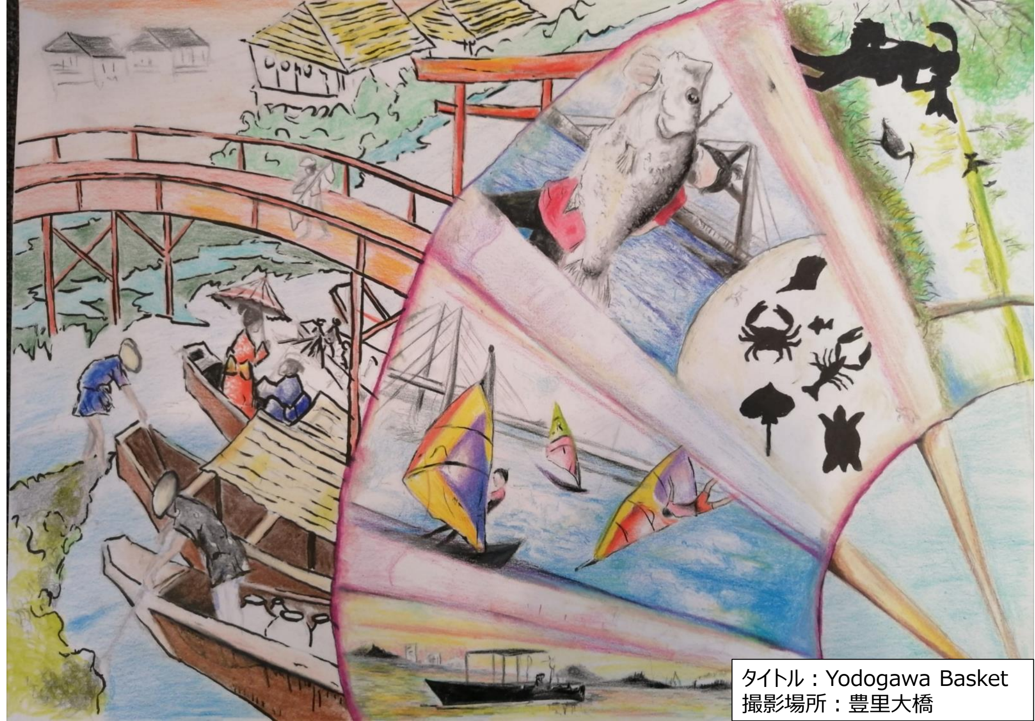
タイトル : Yodogawa Basket 撮影場所 : 豊里大橋