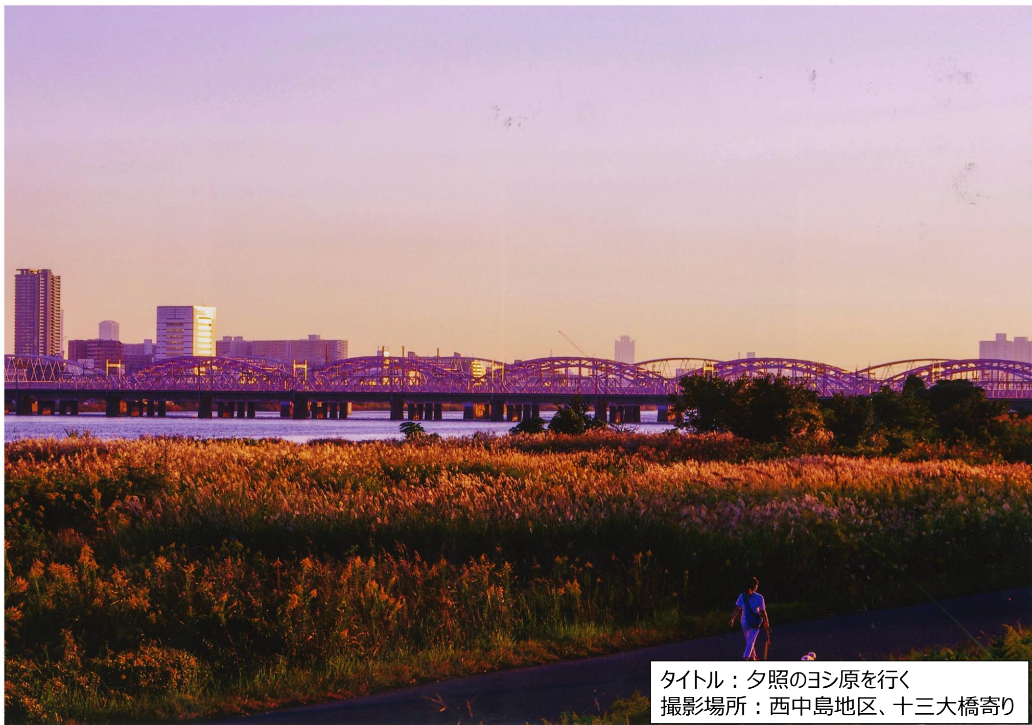
タイトル：夕照のヨシ原に行く 撮影場所：西中島地区、十三大橋寄り