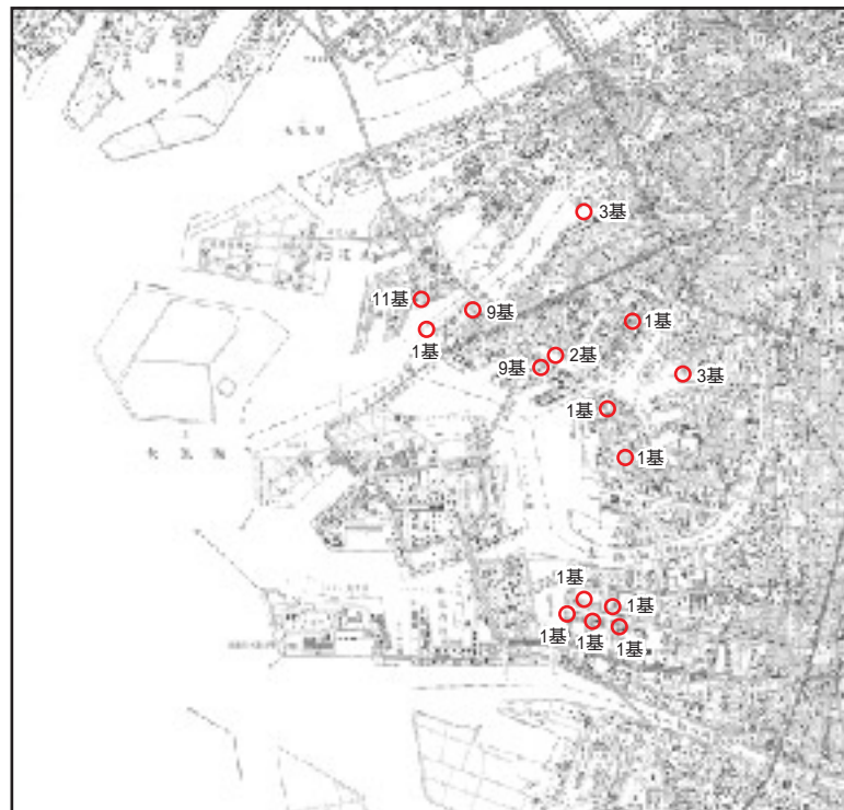
遠隔操作化計画位置図