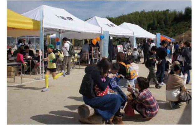
当日は約1500名もの来場者で賑わいました

10月31日、横尾川上流部周辺において、翔け横尾っ子の会・横山校区町会連合会・南横山校区町会連合会主催による森づくり活動の大規模なイベント「横尾っ子まつり × 笑働の森・紅葉まつり」が開催されました。