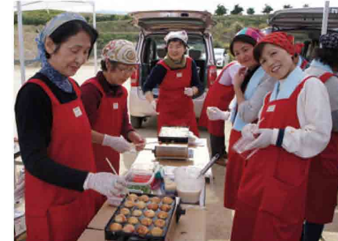
地元町会を中心とする各種団体による模擬店

今年もお祭りは和泉市立南部リージョンセンターを拠点に開催され、演奏・演技や地元町会の各種団体による模擬店などで大盛況となりました。また、横尾川上流部の笑働の森エリアでは「森林ウォークラリー」が開催されました。