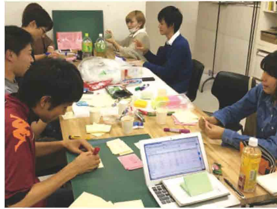
イベントに向けて、笑働の森づくり活動に参加している学生たちが意見を出し合って会議する様子

「笑働の森づくり」の取組みは、これまで2つの機関より高い評価を受け受賞に至りましたので紹介します