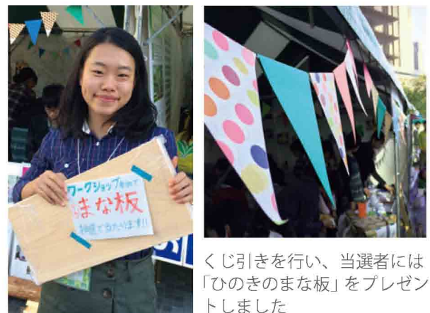
くじ引きを行い、当選者には「ほのきのまな板」をプレゼントしました