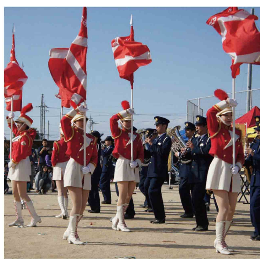
大阪府警察音楽隊による演奏&カラーガード隊による演技