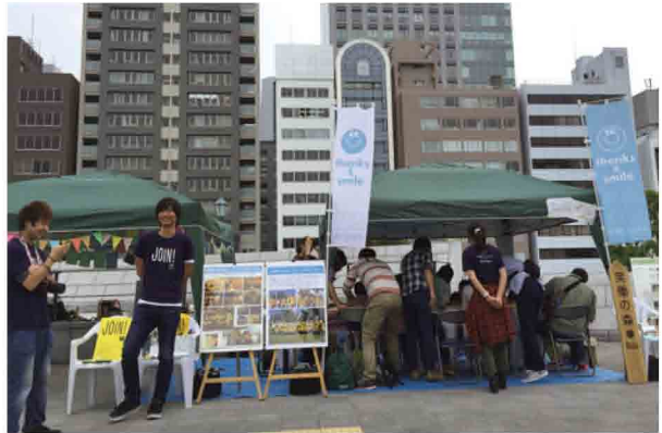
約80名の方にお箸づくりを体験していただきました