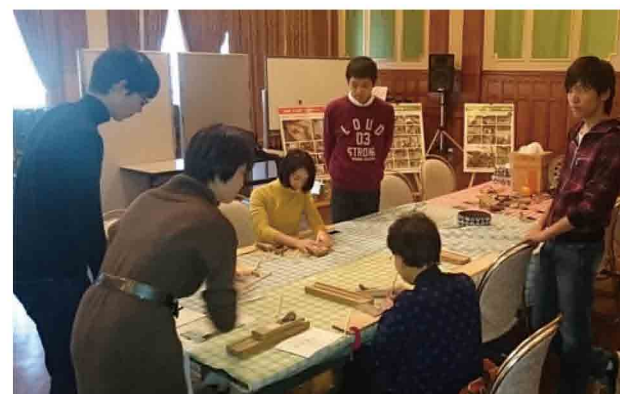
中央公会堂でのお箸づくり作業の様子

11月14日、重要文化財である大阪市中央公会堂において、大阪都市魅力創造プロジェクトが開催されました。笑働の森ブースにも多くの方が訪れ大阪の魅力発信の一翼を担いました。