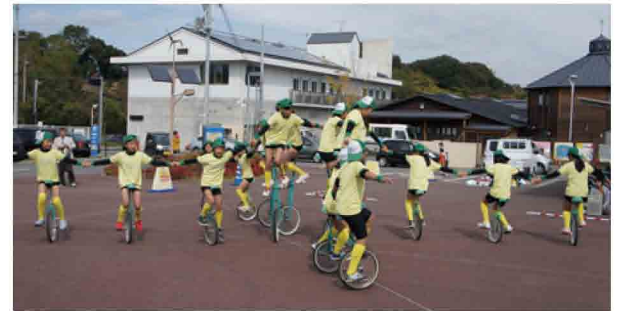
南横山小学校児童による一輪車隊の演技