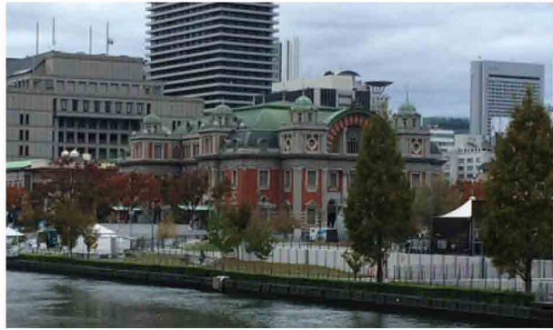
大阪市中央公会堂