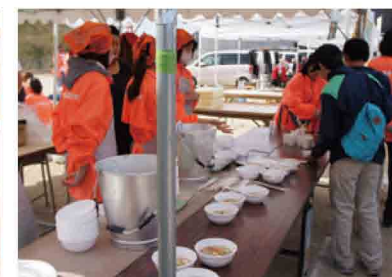
PTAによる豚汁の提供