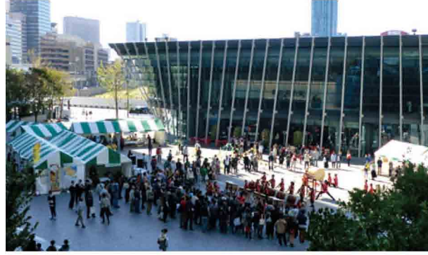
グランフロント大阪 うめきた広場