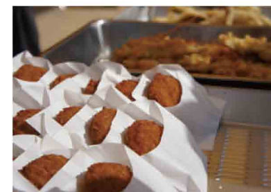
府漁連による泉だこコロケ、ハモ天の販売

今年もお祭りは和泉市立南部リージョンセンターを拠点に開催され、演奏・演技や地元町会の各種団体による模擬店などで大盛況となりました。また、横尾川上流部の笑働の森エリアでは「森林ウォークラリー」が開催されました。