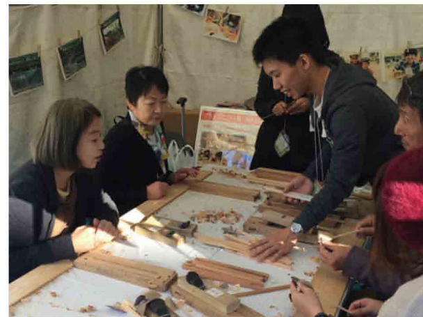
お箸づくり体験は107名の方に参加をいただきました

全国都市緑化月間中の10月25日に、みどりにふれあうイベント「おおさか都市緑化フェア in うめきた」が開催され、笑働の森づくりブースを設置しました。