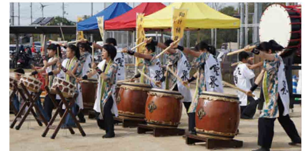
鼓聖泉のみなさんによるいずみ太鼓の演奏