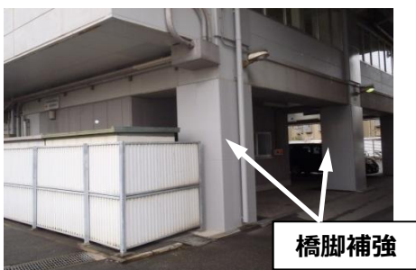
鉄道駅耐震補強の状況

鉄道利用者などの安全確保、および鉄道と交差・近接する広域緊急交通路などの機能確保のため、鉄道事業者が実施する耐震補強事業に補助を行います。