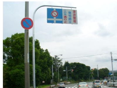
津波注意喚起看板