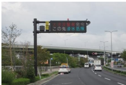
道路情報提供装置