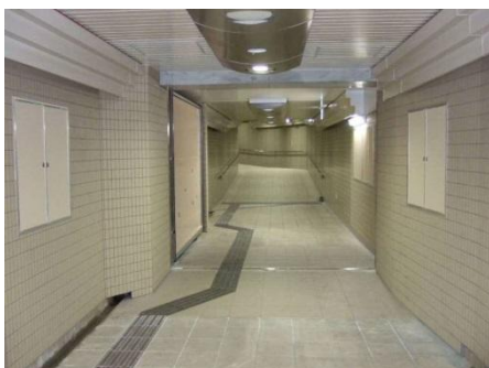
止水扉の設置状況（平常時） （阪神本線 福島駅）

鉄道利用者の安全確保のため、巨大地震発生時に津波などによる浸水被害が想定される地下駅や地下トンネルの出入口において、鉄道事業者が実施する止水扉の設置などの浸水対策を支援します。