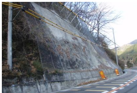
落石・法面崩壊防止対策

近年増加している集中豪雨や、南海トラフ巨大地震による津波などの災害に対応するための対策を実施します。