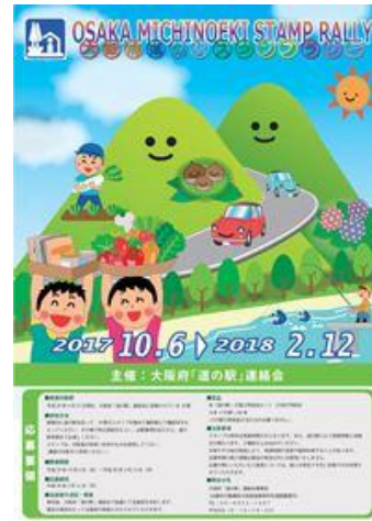
大阪府「道の駅」スタンプラリー

大阪府内の道の駅：「ちはやあかさか」「近つ飛鳥の里・太子」「能勢（くりの郷）」 「かなん」「しらとりの郷・羽曳野」「いずみ山愛の里」 「とっとパーク小島」「愛彩ランド」「みさき」 「奥河内くろまるの郷」