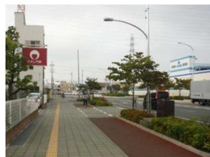
八尾茨木線（門真市）