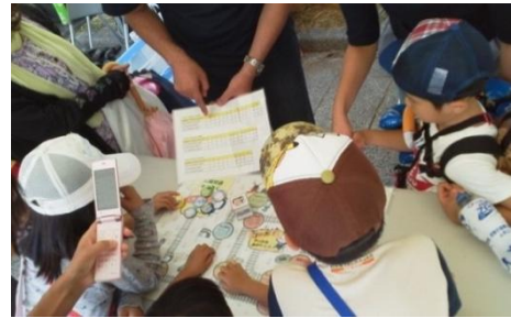
交通安全キャンペーンと連携した利用促進 (交通すごろくの実施)