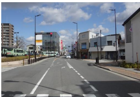
(旧)国道170号（富田林市）

国道170号（羽曳野市）、府道大阪港八尾線（八尾市）、府道堺阪南線（高石市） など