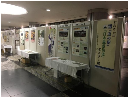
「道の駅」ポスター展

大阪府「道の駅」連絡会において、大阪府内の道の駅と連携し、大阪市内でのPRイベントやスタンプラリーの実施などにより、情報発信機能の拡充や大阪府「道の駅」全体の活性化を図ります。