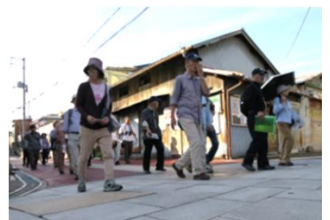
ウォークイベント