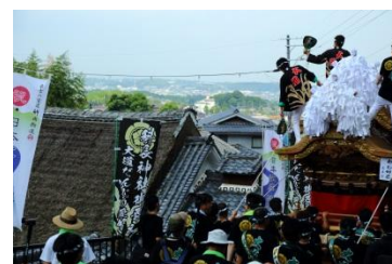
フォトコンテスト