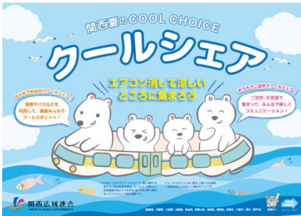
関西広域連合の節電キャンペーンと 連動した利用促進

「みんなでお出かけクールシェア」や「交通安全キャンペーン」と連携した公共交通利用の啓発活動、鉄道からバスへの乗り換え情報の検索などの情報が入手できるOSAKAバスナビといったウェブサイトによる情報発信など、機会を捉えた公共交通の利用促進に向けた取組みを進めます。交通事業者、市町村などと協働し、地域のにぎわいづくりや観光と連携した取組みにより、公共交通の利用機会の増加を促します。