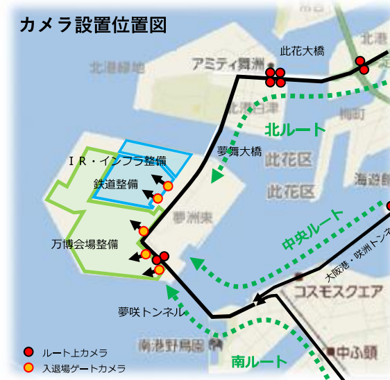
カメラ設置位置図