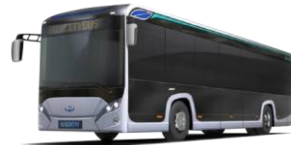
(株)EVモーターズ・ジャパンHP