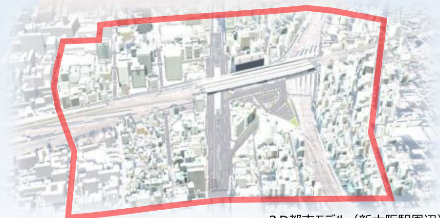
3D都市モデル (新大阪駅周辺)