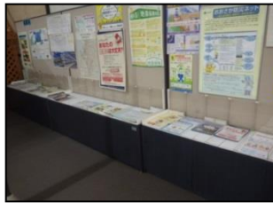
鳳土木事務所 (泉北府民センター)