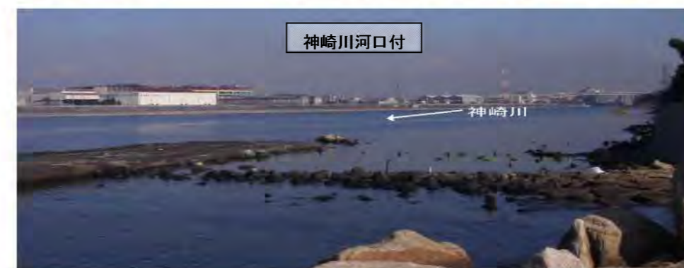
図-1.1 神崎川下流ブロック流域位置図