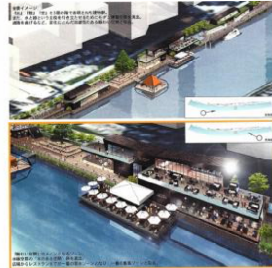
■2015年 シンボルイヤー BANKS構想案