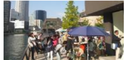
① 全テナント参画「バンクス全体イベント」の開催（年4回）