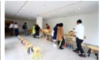
② 各テナントが其々の特色を活かして企画される「独自イベント」（随時）

水辺の商業施設に相応しい企画を次々に生み出すバイタリティー溢れるメンバーがバンクスには揃っています。