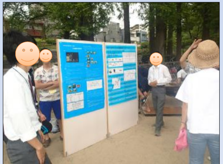
高校生が研究成果を説明中

共催：ふれあいの水辺利用推進委員会・「私の水辺」大発表会実行委員会（中央委員会）・ （地独）大阪府立環境農林水産総合研究所・大阪市立東高等学校・大阪ECO動物海洋専門学校 協力：大阪市・大阪府立環境農林水産総合研究所生物多様性センターサポートスタッフ