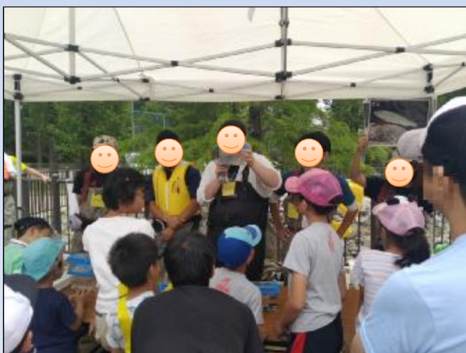
専門学校の皆さんがとれた魚についてわかりやすく説明