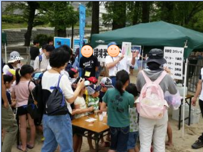
真剣に説明を聞いています