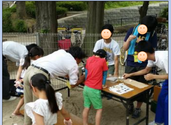
顕微鏡でプランクトン観察