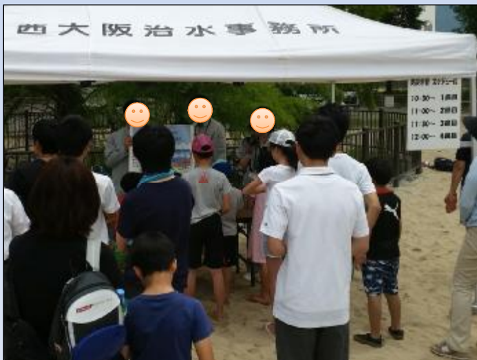
みんなクイズに興味津々