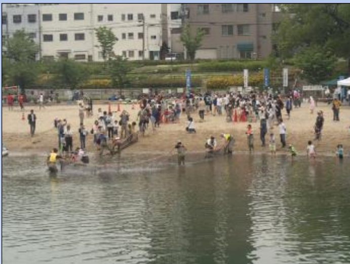
地引網 力を合わせて引きあげます

当日は曇り空でしたが、暑すぎない絶好の地引網日和で、248名の府民のみなさまにご参加いただきました！