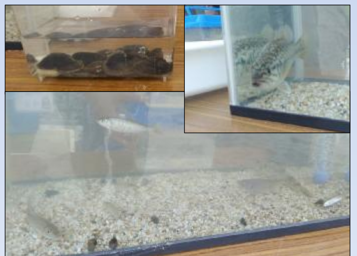
こんな魚や貝がとれました！