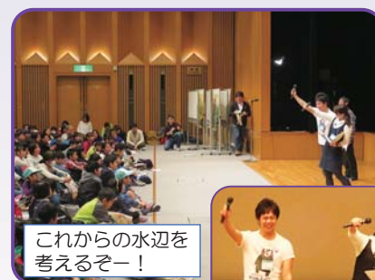
これからの水辺を 考えるぞー！