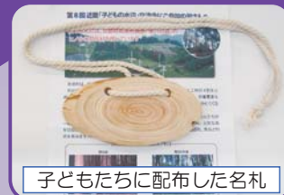
子どもたちに配布した名札