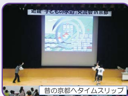
昔の京都へタイムスリップ