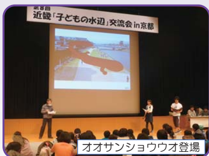
オオサンショウウオ登場

実行委員による水辺の「むかし」に関する寸劇が行われました。オオサンショウウオさんとお兄さん、お姉さんのやりとりを、楽しく鑑賞しながら、水辺の移り変わりについて考えました。