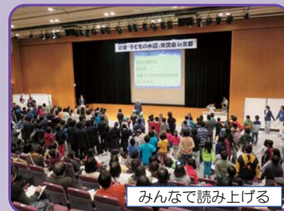
みんなで読み上げる