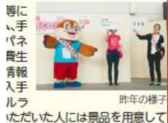
昨年の様子 いただいた人には景品を用意して