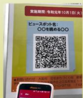
パネルのQRコードを読み取る