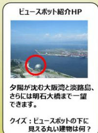
景色を見てクイズに答える！