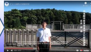
応神天皇陵拝所前