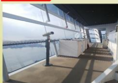
ビュースポットに訪れる