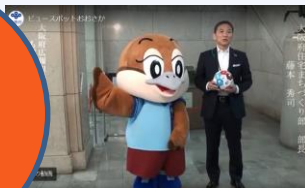
藤本住宅まちづくり部長