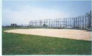
多目的グラウンド