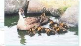
水辺の広場の「カルガモ親子」

開放時間／8:00～17:00 (多目的グラウンドの使用時間／8:30～16:30) 休 み／毎週火曜日及び12月29日～1月3日 問い合わせ先／スカイランド管理棟 (06-6789-7152)