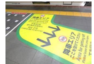
【床面整列乗車シート】