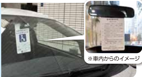
※車内からのイメージ

利用証は駐車する時、 ルームミラーにかける など、外から見えるよう に掲示してください。