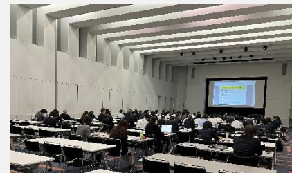
令和5年度 重点整備地区バリアフリー推進連絡会議