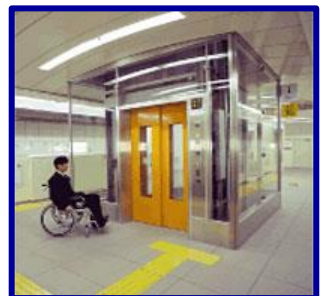
バリアフリー設備の状況