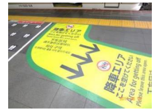
【床面整列乗車シート】