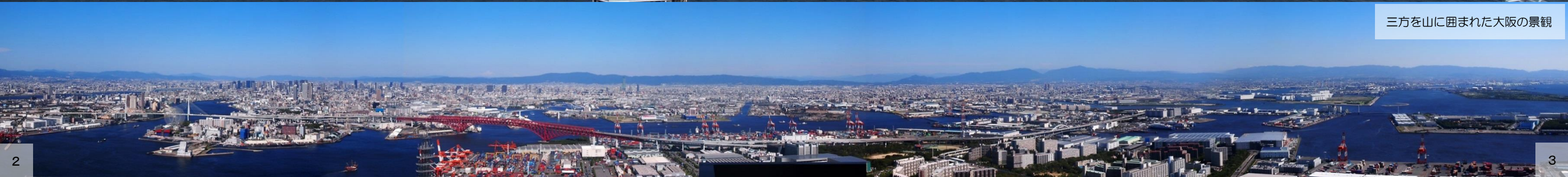
三方を山に囲まれた大阪の景観