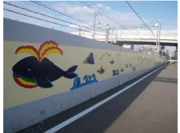
《絵のあるまちづくり 南海鉄道高架東側》