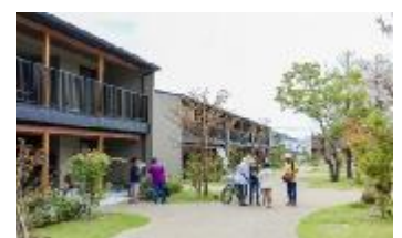
「大阪府知事賞: 大東市公民連携北条まちづくりプロジェクト「morineki」」