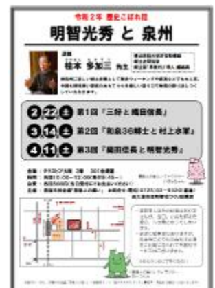
《歴史こぼれ話 チラシ》