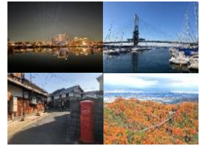
《大阪府の景観資源例》

これらを踏まえて、府の景観形成の基本目標を『きらめく世界都市・大阪の実現』と定め、景観行政に取り組んでいる。