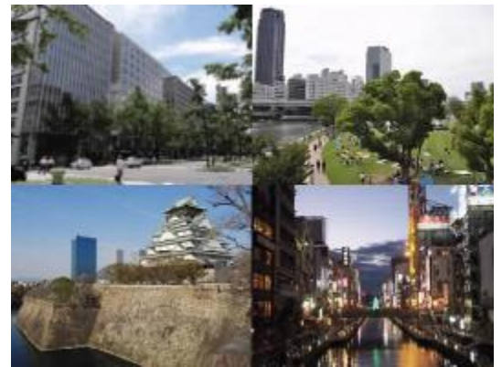
《大阪市の景観資源例》

都市景観の形成は、このようなまちづくりを進める上で重要な役割を果たすことから、地域の特性を生かし、都市の美しさや魅力を創造・発展させることを目的として、まちなみや水辺等の都市景観形成に向けた取組みを進めている。