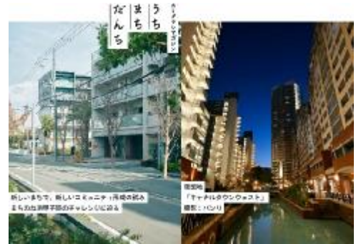
うち まち だんち

機能的な都市活動及び豊かな都市生活を営む基盤の整備が社会経済情勢の変化に対応して十分に行われていない大都市及び地域社会の中心となる都市において、市街地の整備改善及び賃貸住宅の供給の支援に関する業務を行うことにより、社会経済情勢の変化に対応した都市機能の高度化及び居住環境の向上を通じてこれらの都市の再生を図るとともに、都市基盤整備公団から承継した賃貸住宅等の管理等に関する業務を行うことにより、良好な居住環境を備えた賃貸住宅の安定的な確保を図り、もって都市の健全な発展と国民生活の安定向上に寄与することを目的とする。