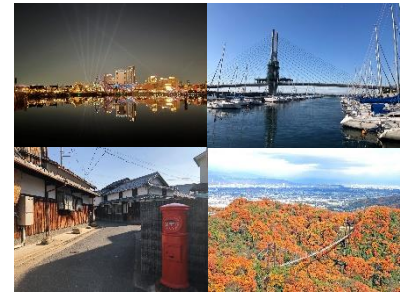
《大阪府の景観資源例》

これらを踏まえて、府の景観形成の基本目標を『きらめく世界都市・大阪の実現』と定め、景観行政に取り組んでいる。