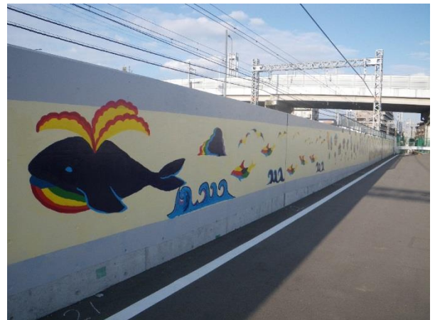
《絵のあるまちづくり 南海鉄道高架東側》