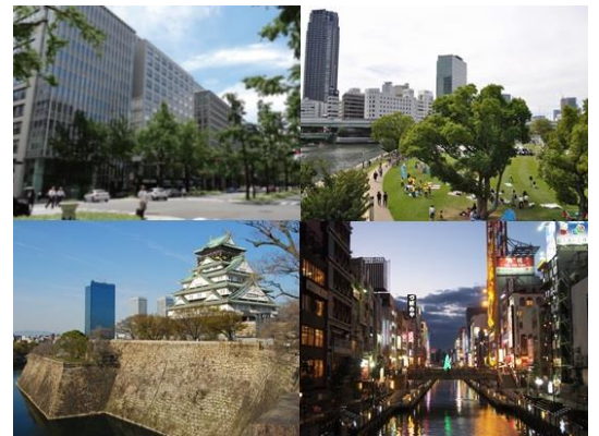
《大阪市の景観資源例》

都市景観の形成は、このようなまちづくりを進める上で重要な役割を果たすことから、地域の特性を生かし、都市の美しさや魅力を創造・発展させることを目的として、まちなみや水辺等の都市景観形成に向けた取組みを進めている。