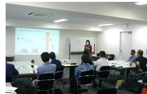
<景観まちづくり講座の講義の様子>

・地域で活躍するまちづくり建築士等にインタビューし、まちづくりの秘訣などを動画でまとめ、WEBによる情報発信をめざす。