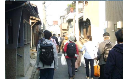
<講義風景と実物古地図を使った解説>