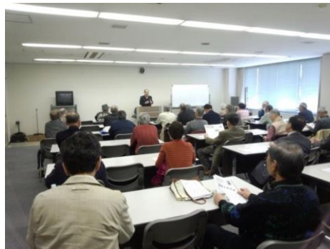
《歴史こぼれ話 チラシ》