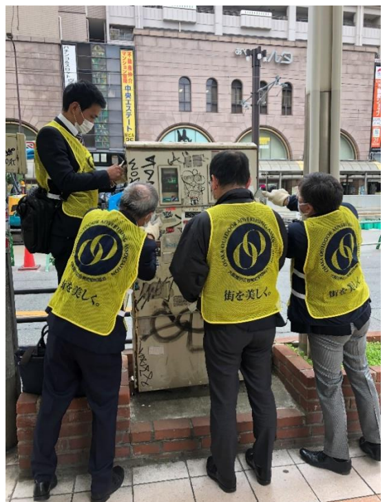
《大阪市「かたづけ・たい」活動風景 R2.11.7 なんば高島屋周辺》