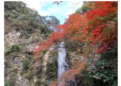
【第1回ビュースポットおおさか選定より箕面大滝を眺める瀧前休憩所】

大阪府では、世界に誇れる大阪の魅力ある景観、きらりと光る個性豊かで多彩な大阪の景観を眺めることができる場所(ビュースポット)を発掘し、「ビュースポットおおさか」として選定、府域内外に情報発信することで、府民・事業者・来訪者の景観への興味・関心の向上を図り、府域全体の良好な景観形成を推進している。令和2年度は、これまでに選定されたスポットの魅力発信(大阪駅デジタルビジョンを活用したプロモーション等)に取り組むとともに、第2回ビュースポット募集を実施した。第2回ビュースポット募集では、府内各所より259件の応募をいただいた。(令和3年夏頃、選定結果を公表(予定))