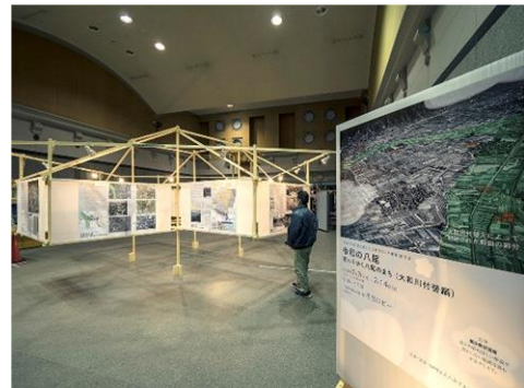
《‘住宅月間行事’での展示の様子》

地域にねざしたすまいまちづくりを実践するための調査研究と、行政と住民との協働のまちづくりを行い、もって豊かな地域社会の創造と社会福祉の増進に寄与することを目的としています。NPO 法人八尾すまいまちづくり研究会は、略称『まち研』とも、呼ばれています。