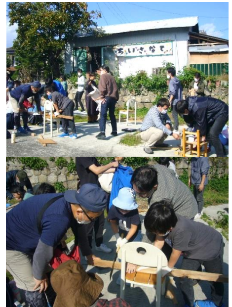
<河内いえ・まち再生会議の活動の様子>

・オープンナガヤ大阪実行委員会主催「オープンナガヤ大阪(大阪の古い長屋を公開し情報発信するイベント)2020年度はオンラインで開催」の後援を実施。(10年目の後援)