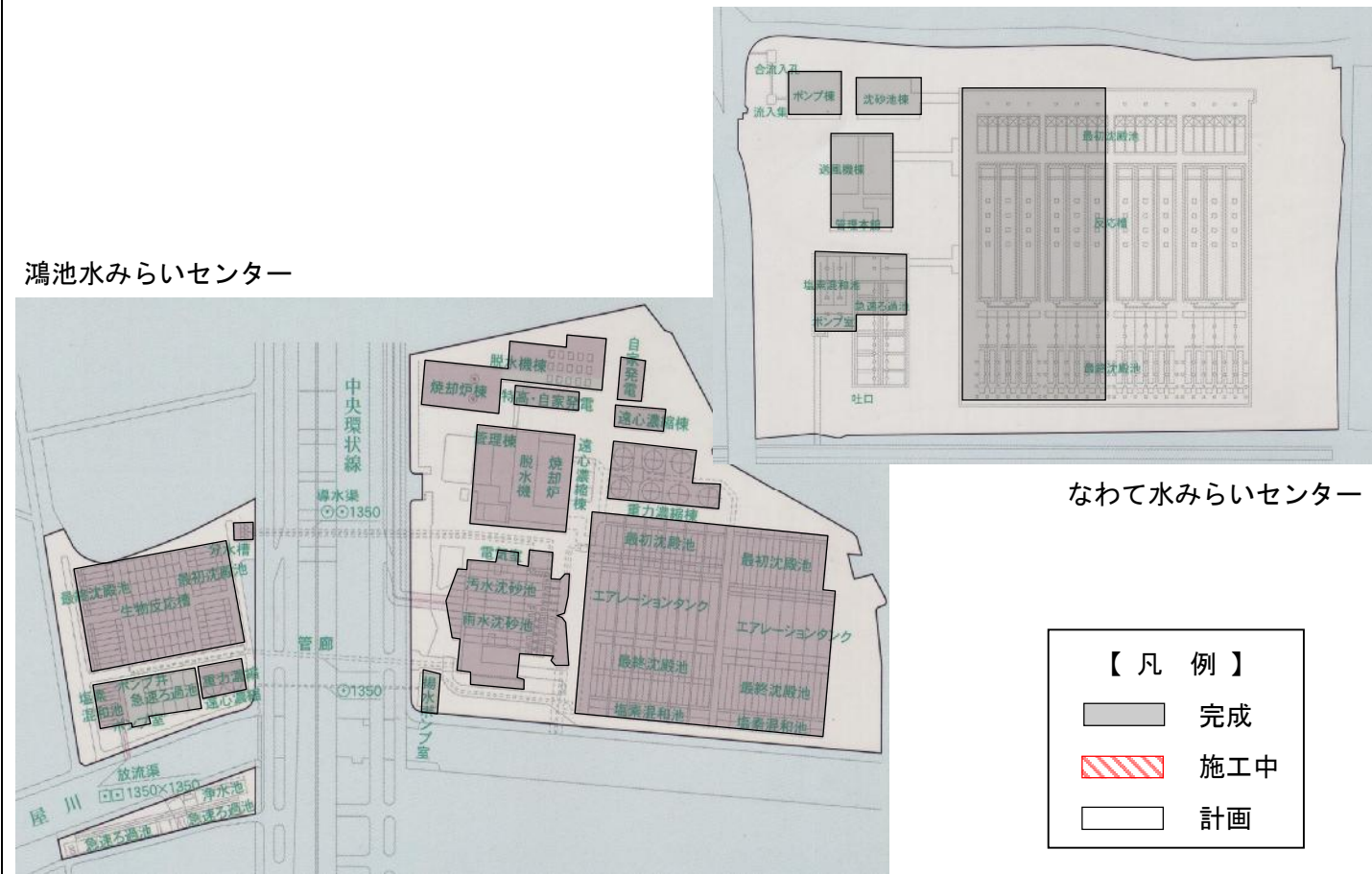
鴻池水みらいセンター、なわて水みらいセンター(処理場)