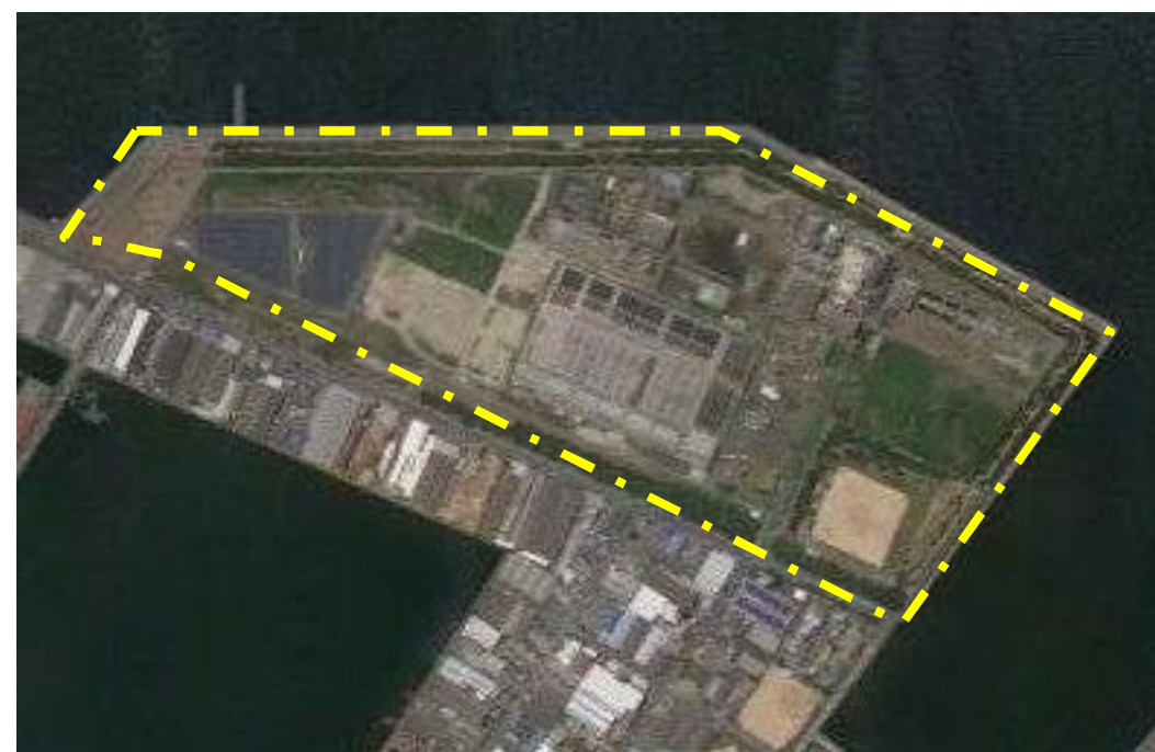
北部水みらいセンター(処理場)