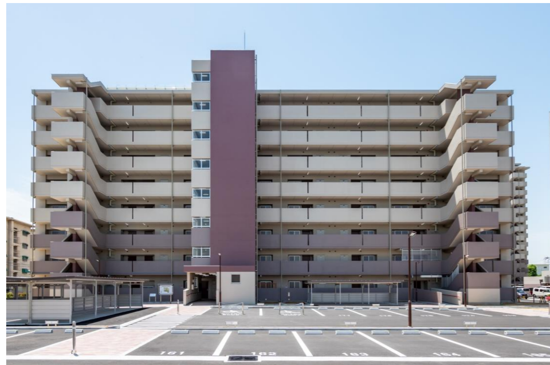
現況写真 (現況配置図(建替後)①から撮影)