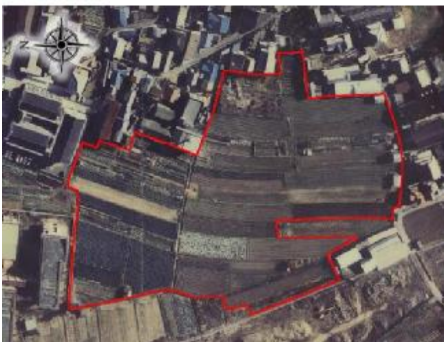
▼航空写真（施行前：平成6年）