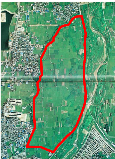
▼航空写真 (施行前：昭和41年頃)