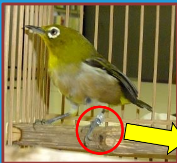
足環のついたメジロ