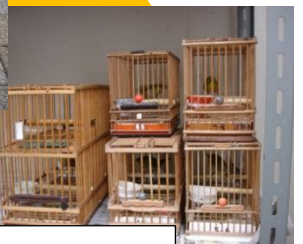
違法飼養で押収されたメジロ

大阪府環境農林水産部 動物愛護畜産課野生動物グループ TEL:06-6210-9619