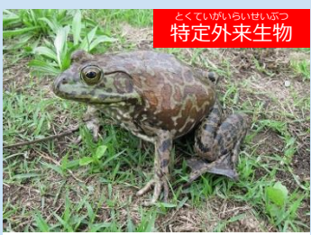
とくていがいらいせいぶつ 特定外来生物