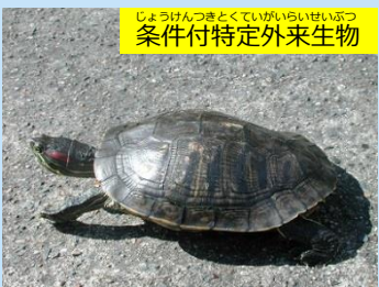
じょうけんつきとくていがいらいせいぶつ 条件付特定外来生物