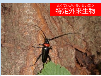
とくていがいらいせいぶつ 特定外来生物