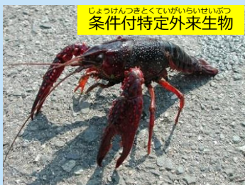
じょうけんつきとくていがいらいせいぶつ 条件付特定外来生物