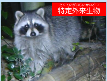
とくていがいらいせいぶつ 特定外来生物