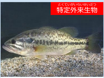
とくていがいらいせいぶつ 特定外来生物