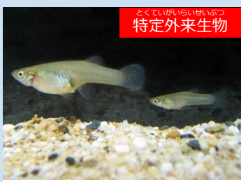
とくていがいらいせいぶつ 特定外来生物