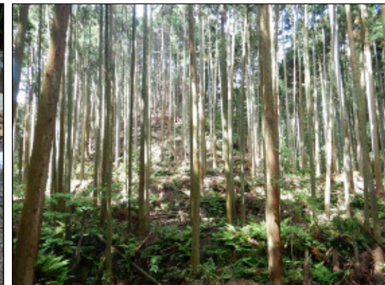
森林整備(間伐)による表土流の防止(河内長野市)