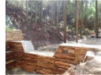
土石流や流木の被害を防ぐ治山ダム