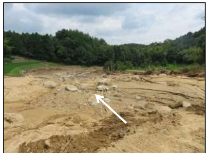
治山ダムがなく下流農地において 甚大な被害が発生(豊能町)