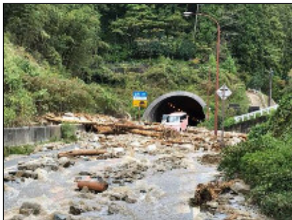
土石・流木流出による国道通行止 平成29年10月(千早赤阪村)