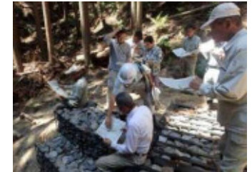
減災対策（防災教室）