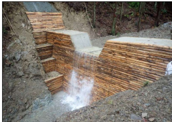
治山ダムの設置により、溪流勾配を緩和し、土石流の発生を未然に防止(貝塚市)