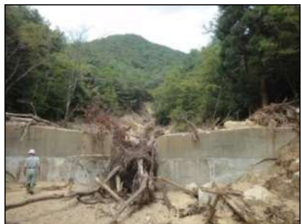
治山ダムによる土砂・流木の捕捉 (能勢町)