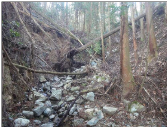
流木となる恐れのある林内の倒木・危険木の状況(能勢町)