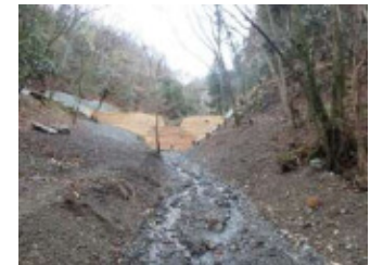
溪流沿いの危険木の除去 (単位：千円)