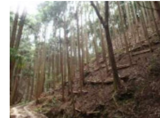
災害に強い強度間伐による森づくり