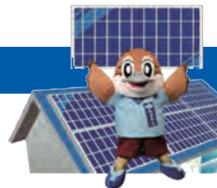
大阪府広報担当副知事 もずやん

事業者の皆さまに太陽光パネルを初期投資不要でお得に導入いただける共同調達支援事業を実施します。 太陽光発電の導入により、経営の脱炭素化と電気料金高騰のリスク低減を図ることができます。ぜひご検討ください。